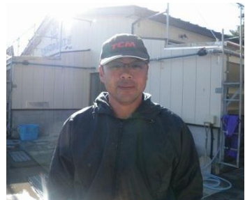
かき剥きで大忙しの伏見支部長

浜の壁新聞は1～2ヶ月に1回発行していきます。今後、事務局が各浜の漁業士に突撃取材を行うことがあると思いますが、御協力をお願いします。