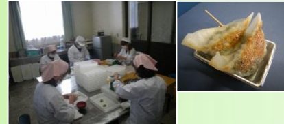
一つ一つ手作りです