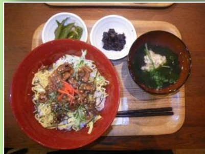
あなご丼(煮穴子がたくさん)