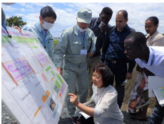
▲「西小松地区」での説明の様子