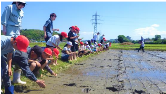
▲ 田植え体験（広瀨小）