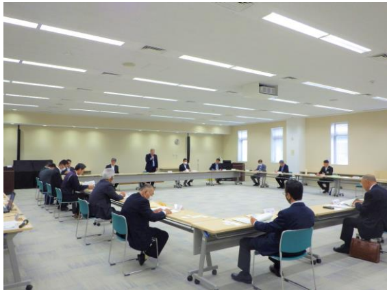
▲ 農政部長陸副部長からの挨拶

5月30日木曜日、石巻合同庁舎にて、石巻市、東松島市、管内土地改良区、宮城県土地改良事業団体連合会、みやぎ農業振興公社、いしのみき農業協同組合の代表者を集めた地域懇談会を開催しました。