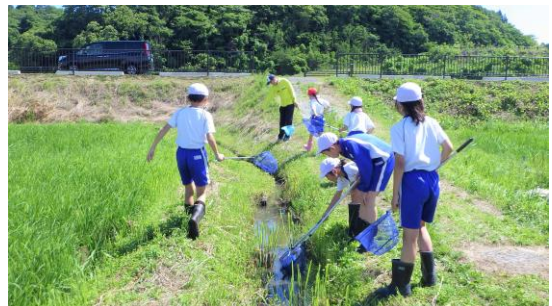
▲ 生き物調査（鳴瀬桜華小）