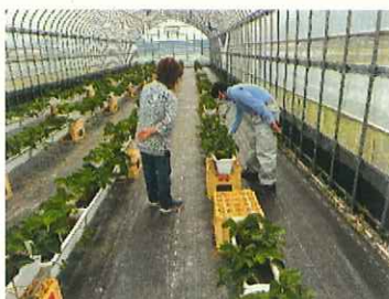
JA 部会への個別指導

環境制御技術等の取り組みや栽培管理技術の習得により、収量が安定していると感じている。さらに栽培技術の向上により収量、販売額を増やし、いちご部門の経営安定を図りたいので、今後も技術的な指導や情報提供を継続してほしい。( (株)黄金ファーム栽培担当者)