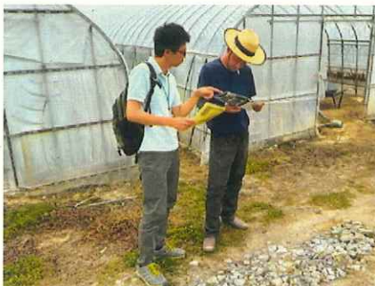
青年部員への労働力確保の提案

昨年度からの指導のおかげで自分の圃場の状態を把握でき、生産改善に取組んだ結果、昨年まで収穫できなかった3~5月においても今年は無事に出荷することができた。夏の猛暑対策について案内いただいた補助事業を活用して取組み、より品質のよいスリムねぎの出荷を目指している。共同選別場の件はぜひとも進めたいため、引き続き支援をお願いしたい(スリムねぎ部会青年部長)