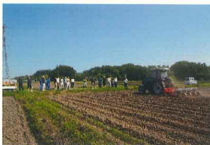
高速畝立て播種機実演会