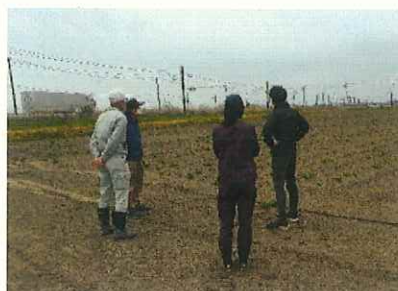
萌芽状況の確認、打ち合わせ