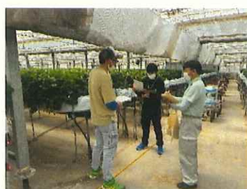
農業法人での勉強会