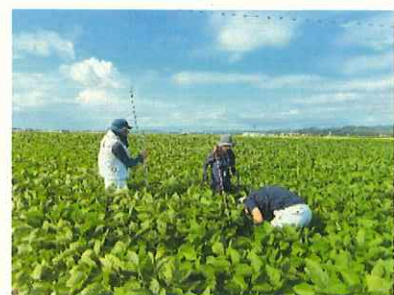
種子大豆生育調査