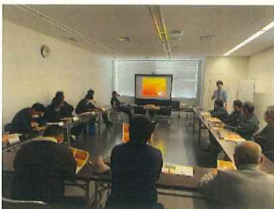
種子大豆播種前研修会