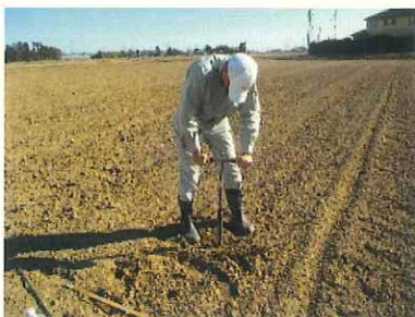
透水性調査の様子

透水性調査や排水対策の指導により、順調に生育し、昨年よりも手応えを感じている。今後も継続した支援をお願いしたい。(株)めぐいと代表)