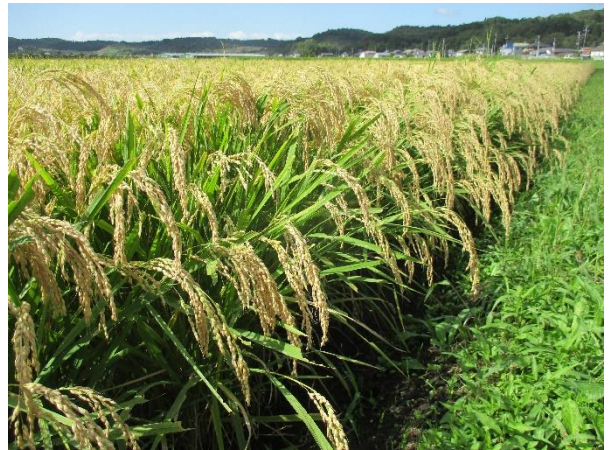
10俵/10aを超える収量となった「だて正夢」