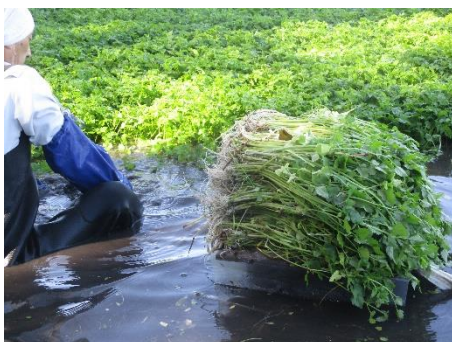
この後、洗浄、調製を経て、出荷されます