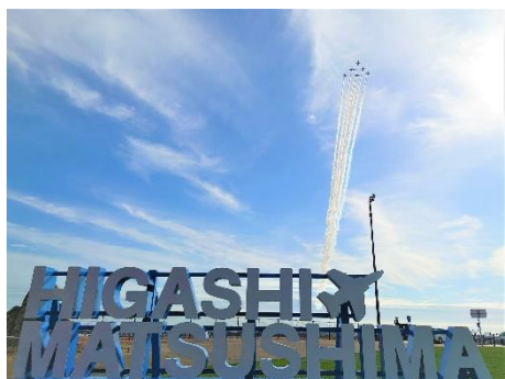
ブルーインパルスによる飛行（開業式典）

11月27日、東松島市に「道の駅 東松島」がオープンしました。「道の駅 東松島」は、三陸沿岸道路上り線矢本パーキングエリア（PA）に直結しており、高速道路を利用する方にも便利な施設です。また、一般道からもアクセス可能で、非常に利便性の高い道の駅となっています。施設では、石巻地方の農水産物などを販売する物販エリアや飲食エリアのほか、市街地を一望できる展望デッキなどを楽しむことができます。建物の各所に航空自衛隊松島基地に所属する曲技飛行チーム「ブルーインパルス」のデザインが施されているのが特徴です。