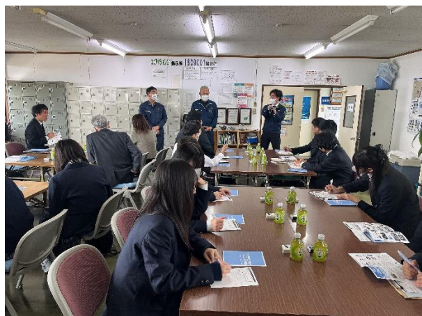
石巻地域産業学習会の様子

日京工業ではコンビニエンスストアのドリンクサーバーやガソリンスタンドの給油機に使用されている電磁弁コイルなどを、エヌエス機器ではロケットや飛行機に用いられる部品など、それぞれの企業の製品が様々な分野で活躍していることを学び、説明内容に対して生徒が積極的に質問する姿も見られるなど、実りのある学習会になりました。