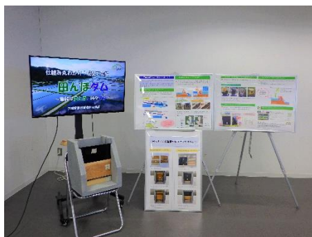
パネル展示イメージ