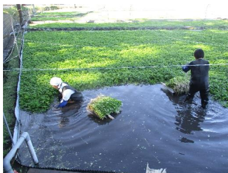
せり田に腰までつかり収穫します