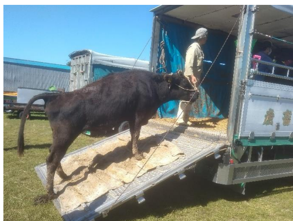
飼い主の待つ我が家に帰ります

また、放牧期間中は、放牧時に問題となるタイレリア症の検査や体重測定等を行い、放牧牛の健康管理に努めました。今夏の猛暑は、暑さに弱い牛にとっては厳しく、牧草地の維持管理も難しかったのですが、大きく体調を崩す牛も少なく、退牧を迎えることができました。