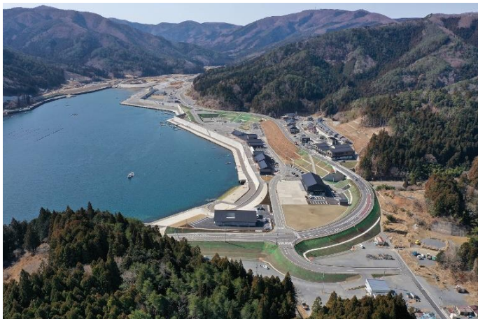
雄勝防潮堤災害復旧事業（全景）

東日本大震災で被災し、令和5年1月に工事が完成した雄勝漁港の雄勝防潮堤災害復旧事業が、令和6年6月26日に全建賞を受賞しました。全建賞は、（一社）全日本建設技術協会が、秀でた成果が得られた事業を表彰するものです。