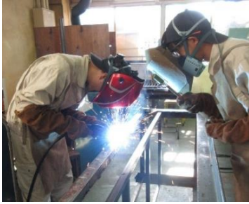
金属加工科の「作業台製作作業」