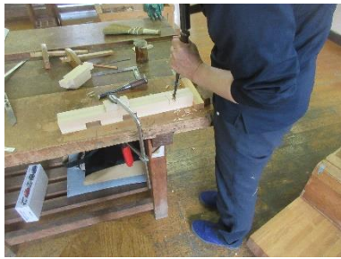
木工科の「蟻形相欠き接ぎ実習」

将来、技術を身に付けて就職したいと考えている方、本校で職業訓練を受けてみませんか。