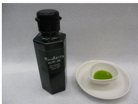
石巻産オリーブオイル「MinoResta OLIVE OIL」

■ お問い合わせ 東部地方振興事務所 農業振興部 先進技術第二班 電話番号 0225-95-1435