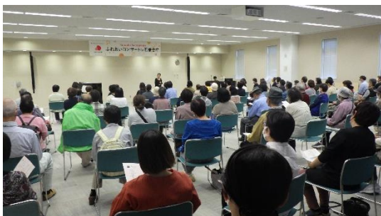
第5回コンサートの様子

令和5年度「山大 Sustainable ふれあいコンサート in 石巻合庁」の第4回を9月20日（水）、第5回を10月18日（水）、第6回を11月15日（水）に開催しました。