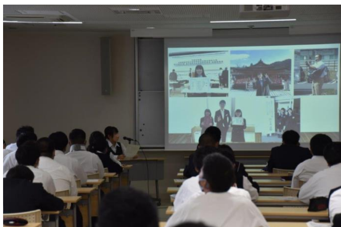
高校OBの若手社員による講話の風景

例年12月に行われる類型選択において、生徒の意思決定の参考となるよう、10月4日（水）に宮城県水産高等学校1年生を対象とした地域の若手社会人講話を開催しました。一般財団法人まちと人による、講話を聴く上での心構え等のレクチャーを実施後、(株)あいのや、(株)遠藤商会、カガク興商(株)に勤務する水産高校OBの若手社員の方々に、自らの高校時代、就職活動、職場での業務について講話いただきました。