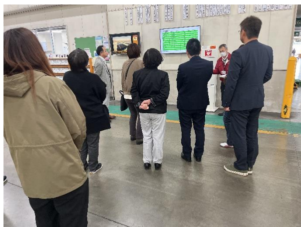
株式会社石巻青果にて市場の説明を受ける様子

高校生の進路選択に大きな影響を与える保護者に対し、石巻地域の魅力ある産業（企業）を紹介することにより、地元企業への理解を深め、管内高校生の地元就職促進に繋げることを目的とし、11月18日（土）に石巻商業高等学校を対象とした保護者向け企業見学会を開催しました。