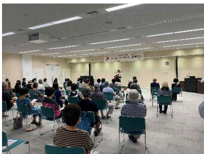
第4回コンサートの様子