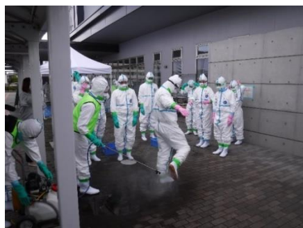
従事後は全身を消毒します。

鳥インフルエンザや豚熱等の発生に備え、関係機関との役割分担の確認と連携強化のために10月5日(木)に石巻合同庁舎にて防疫演習(机上演習、初動対応訓練)を実施しました。机上演習では管内養鶏場での発生を想定し異常鶏の通報から対策会議の開催、防疫作業の開始まで、各関係機関との情報伝達について時間経過を意識しながら一連の流れについて確認しました。