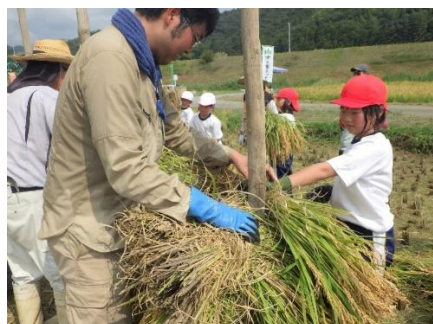
棒掛け体験の様子

9月19日、石巻市立北上小学校3年生9名が、5月に田植えを行った「みやこがねもち」の稲刈りを体験しました。地元の北上地区保全会(多面的機能支払活動組織)の主催で、令和3年度から毎年実施されています。