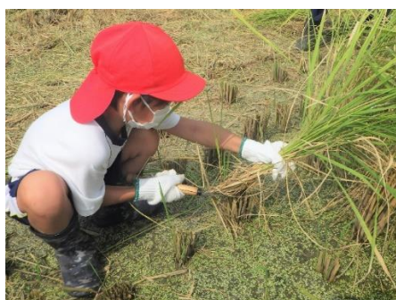
稲刈り体験の様子