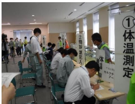
従事者の受付では、体調のチェックも行います。