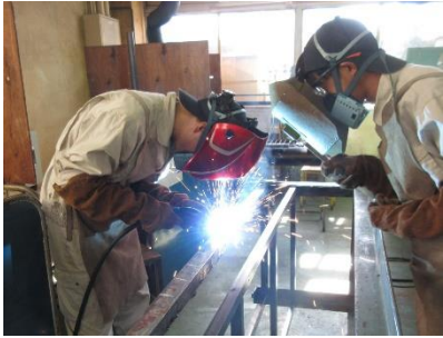
金属加工科の「作業台製作作業」