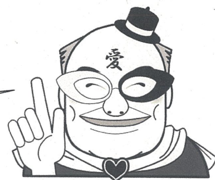
石巻保健所性感染症予防キャラクター ミスター・アイ