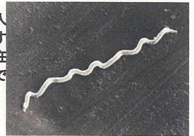
梅毒トレポネーマの電子顕微鏡像（ネガティブ染色）