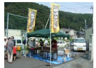
【石巻焼きそば教室の様子】