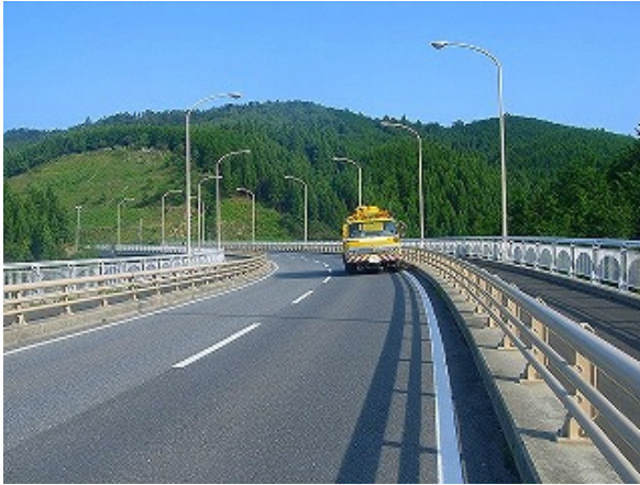
風越橋清掃状況（路面清掃車）