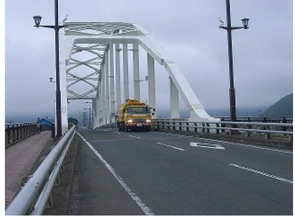
万石橋清掃状況（路面清掃車）