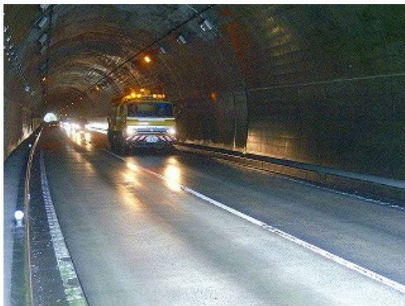
小積トンネル清掃状況（路面清掃車）