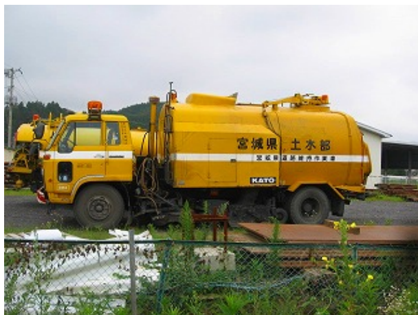
路面清掃車 昭和57年9月登録(27年経過)