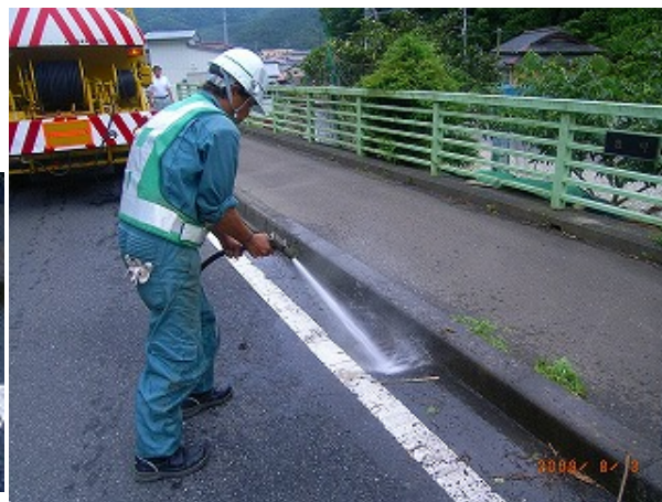
戸根入橋清掃状況