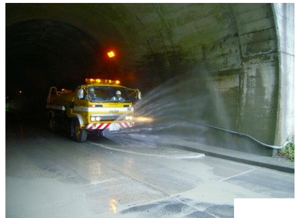
高白トンネル壁面清掃状況