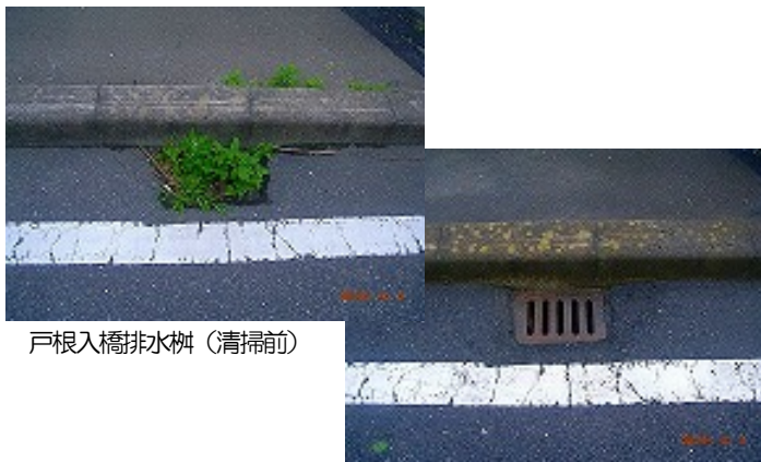
戸根入橋排水柵 (清掃前)