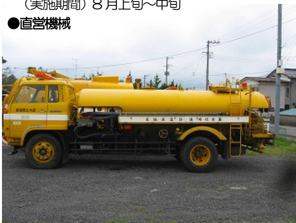
高圧洗浄車 昭和53年10月登録(31年経過)