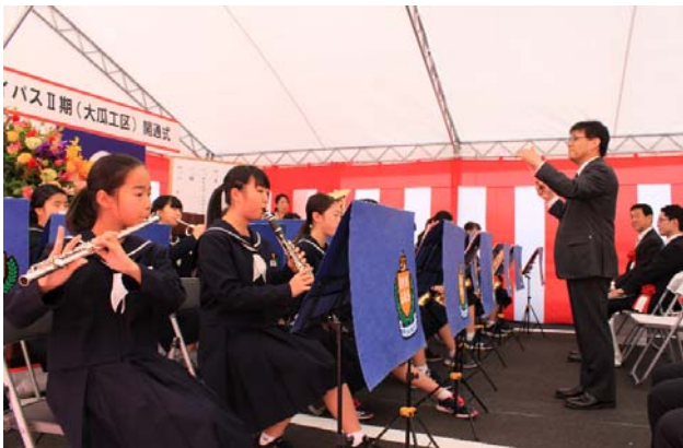
【稲井中学校による吹奏楽演奏】