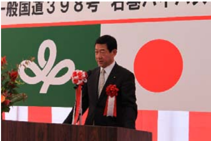
【祝辞：衆議院議員 伊藤信太郎 様】