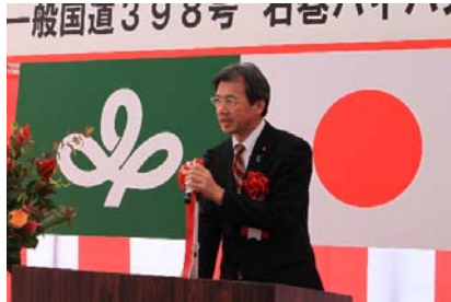
【祝辞：衆議院議員 秋葉賢也 様】