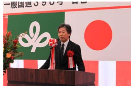
【祝辞：衆議院議員 安住淳 様】