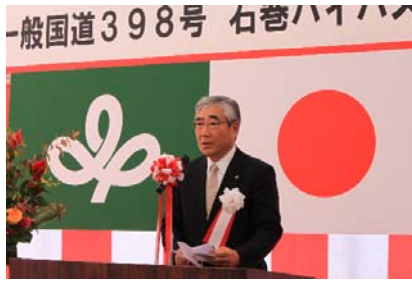
【挨拶：石巻市長 亀山紘】