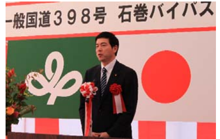
【祝辞：参議院議員 愛知治郎 様】