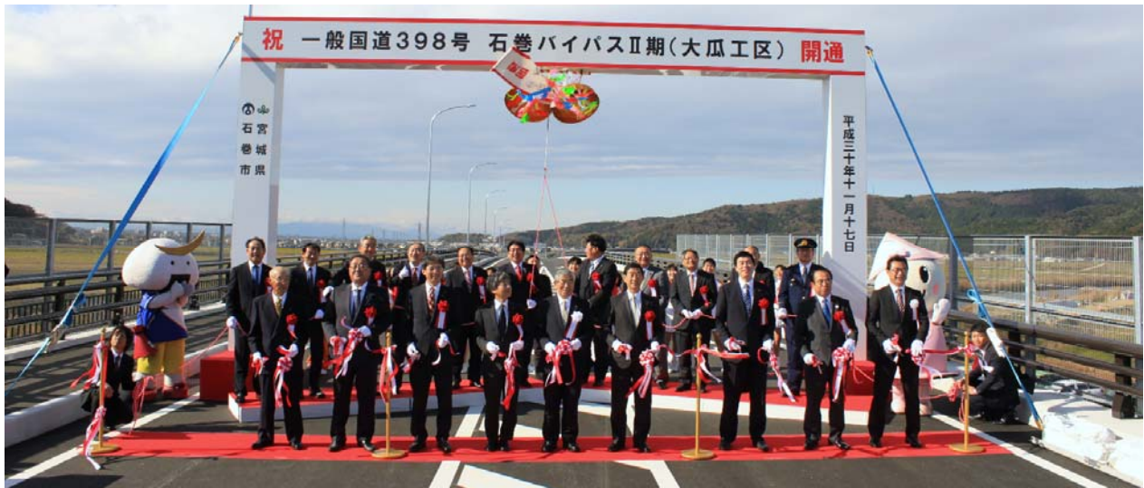
【テープカット及びくす玉開披】

当日は開通式を開催し、国会議員、県議会議員、市議会議員、関係市町の長のほか国土交通省や復興庁をはじめとする関係機関及び地元行政区長など総勢約70名の方々に御出席いただき開通を祝しました。