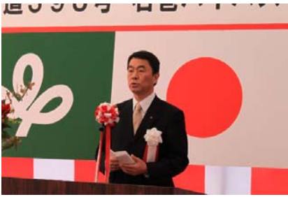
【挨拶：宮城県知事 村井嘉浩】