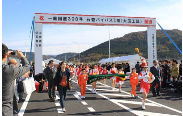
【稲井小学校による鼓笛パレード】