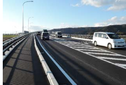
【供用開始後の状況（大和田川橋）】