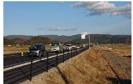
【供用開始後の状況（市道休石1号線付近）】