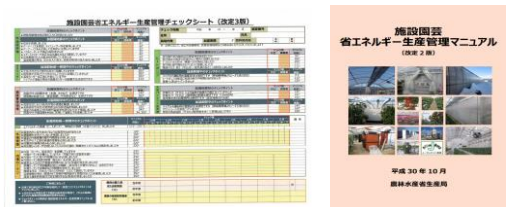
▲省エネチェックシート ▲省エネマニュアル