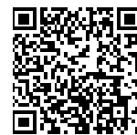
▲省エネ通知のページQRコード ▲省エネで収益力向上を