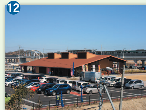
※写真の転載はできません