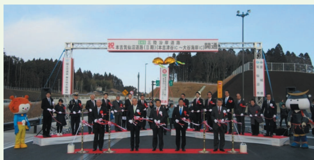
▲本吉気仙沼道路Ⅱ期の開通式