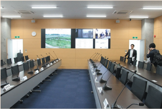
▲中央のモニターは8つの画面で構成されており、各地に設置されたカメラを通じ、増水や冠水の状況を映し出します。

石巻市が市役所東側に建設していた「石巻市防災センター」が今年の3月末に完成し、5月31日に開所式が行われました。防災センターは、高さ約15メートルの中間免震構造の鉄筋3階建てで、災害時の司令塔を担うほか、通常は東日本大震災の教訓を生かした啓発セミナーや勉強会など、市民の防災意識向上に向けた活動が行われます。