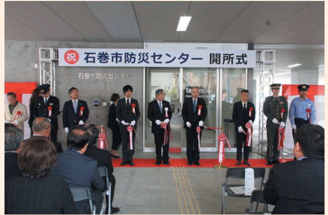
▲テープカットのようす。