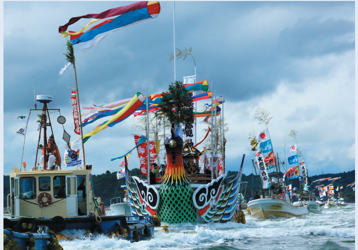
▲神輿海上渡御のようす