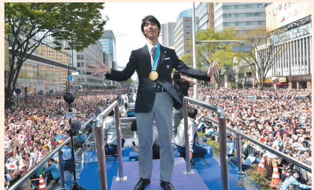
▲約1kmのパレードコースは羽生選手を祝福するファンでいっぱいです。