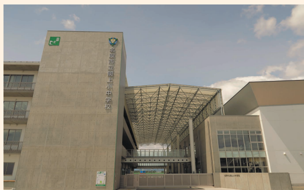
▲向かって左側が校舎。右側が体育館。手前に外階段があり、屋上に登ることができます。