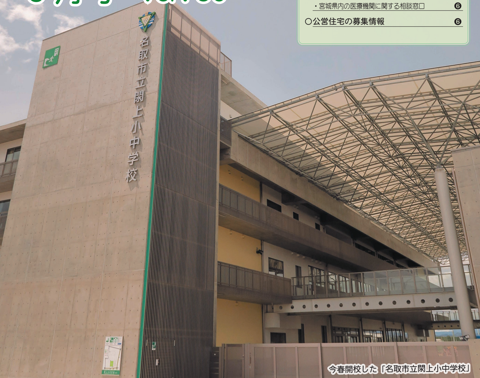
今春開校した「名取市立閑上小中学校」