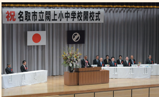
▲開校式のようす