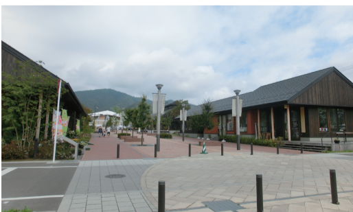
複合型商業施設『シーパルピア』と女川駅(女川町)