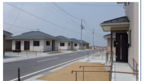
名取市閑上に完成した災害公営住宅②(名取市)