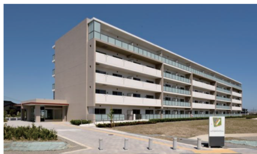
名取市閑上に完成した災害公営住宅①(名取市)