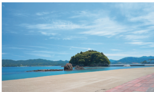
7月15日 海水浴場サンオーレそではまオープン