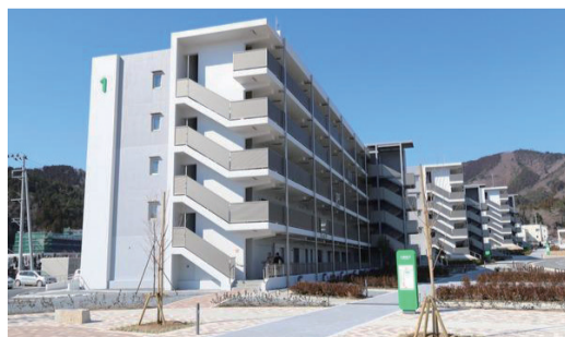
2月26日 大原住宅入居式(女川町)