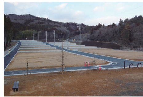
小泊・大室地区（石巻市）