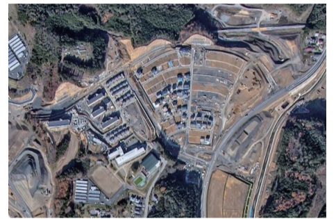
志津川中央地区（南三陸町）