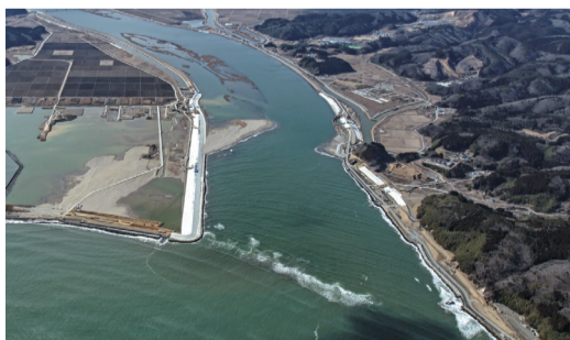
2月25日 北上川河口部の堤防完成(石巻市)