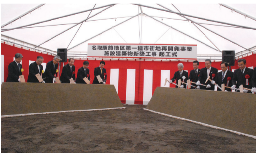
1月27日 新名取市図書館起工式(名取市)