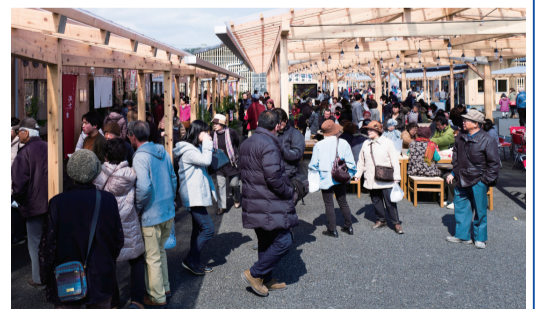
3月3日 さんさん商店街が移転オープン(南三陸町)