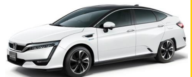
CLARITY FUEL CELL (出典：本田技研工業(株)HP)

スマート水素ステーションは、県保健環境センター（仙台市宮城野区）に設置されます。太陽光発電を利用して水を電気分解し、水素を製造します。1日あたり、FCVが約150キロメートル走行するために必要な水素を製造し、約1,900キロメートル走行分の水素を貯蔵することができます。スマート水素ステーション (出典：本田技研工業(株)HP)