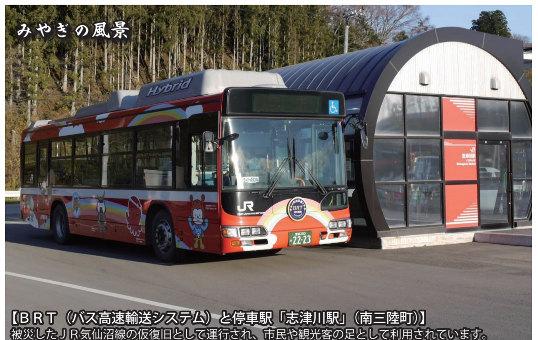
【BRT(バス高速輸送システム)と停車駅「志津川駅」(南三陸町)】被災したJR気仙沼線の仮復旧として運行され、市民や観光客の足として利用されています。