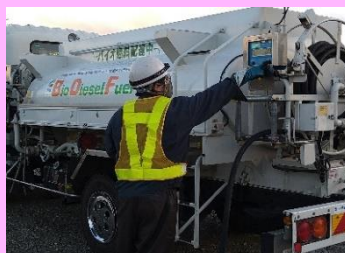
タンクローリー による配送