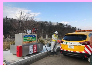
簡易給油タンク も利用可能