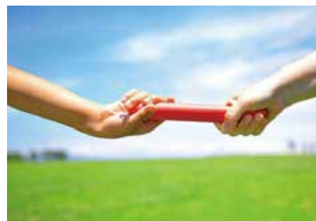
【事業承継の意向別の割合】(60代以上)

宮城県事業承継・引継ぎ支援センターは、そんな方のご相談に対してアドバイスを 行う公的支援機関です。事業引継ぎに精通した専門家(弁護士、公認会計士 等)が無料でお話を伺いますので、お気軽にご相談ください。国(東北経済産業 局)から委託を受けた事業なので、安心してご相談いただけます。