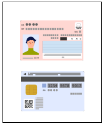
マイナンバーカード(写)等