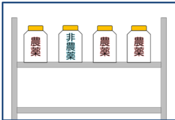
× 仕切りがなく、農薬と非農薬が混在する

また、「農薬として使用することができない除草剤」を農作物等の栽培管理に使用した場合には、その使用者は罰せられることとなっています。当該除草剤を陳列する場合は、農薬との区分に配慮し、公衆の見やすい場所に農薬として使用することができない旨の表示を行ってください。