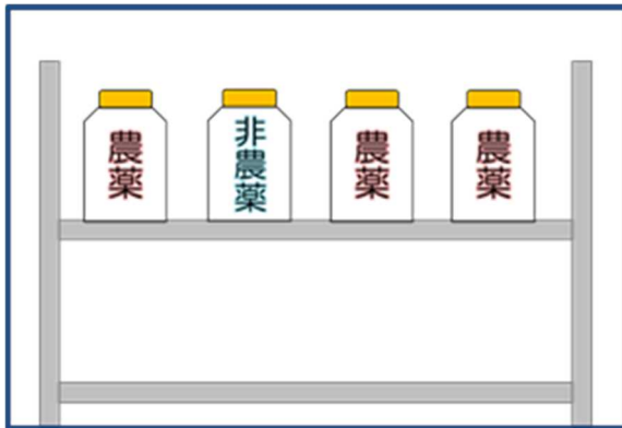
× 仕切りがなく、農薬と非農薬が混在する

また、「農薬として使用することができない除草剤」を農作物等の栽培管理に使用した場合には、その使用者は罰せられることとなっています。当該除草剤を陳列する場合は、農薬との区分に配慮し、公衆の見やすい場所に農薬として使用することができない旨の表示を行ってください。