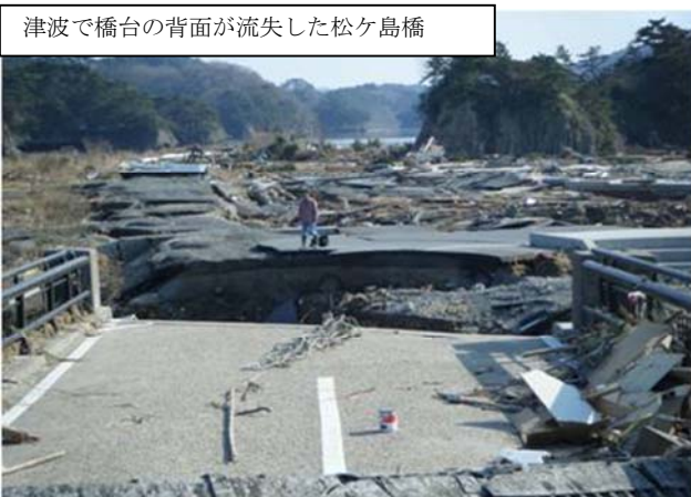
津波で橋台の背面が流失した松ヶ島橋