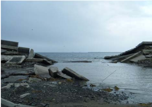
長浜海岸（石巻市渡波長浜地内）