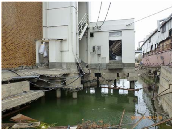
津波により被災した庁舎