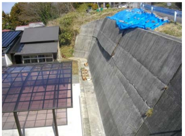
氷室急傾斜地 (大崎市松山字氷室地内) 平成23年4月8日撮影