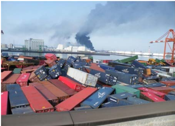
仙台港中野埠頭（仙台市宮城野区） 平成23年3月13日撮影