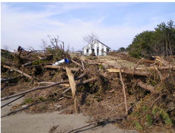
岩沼海浜緑地 (岩沼市下野郷地内)