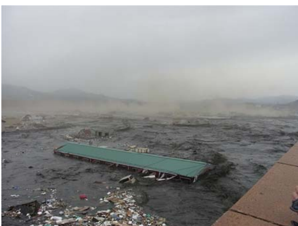
津波襲来時の状況 その3