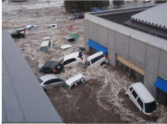
津波襲来時の状況