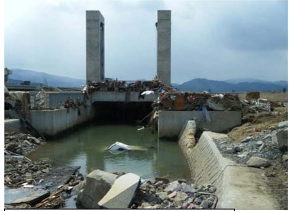
大沢川分派水門（石巻市北上町橋浦地内）