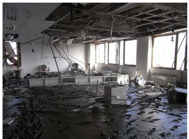
津波により被災した合同庁舎