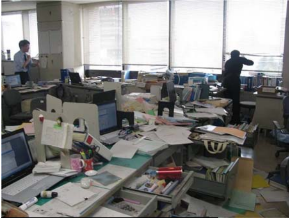
地震により書類等が散乱した執務室