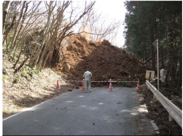
亘理大河原川崎線（川崎町支倉地内）平成23年3月14日撮影