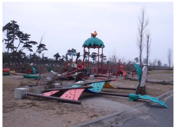
矢本海浜緑地 (東松島市大曲地内)