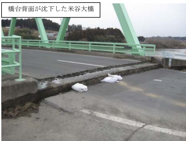
橋台背面が沈下した米谷大橋