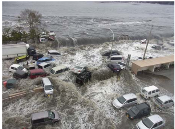
津波襲来時の状況 その2