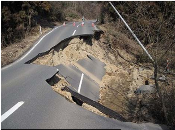
栗駒岩出山線（大崎市岩出山堂の沢）