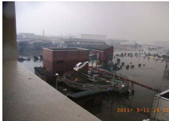
東部浄化センター下水処理施設（石巻市魚町地内）