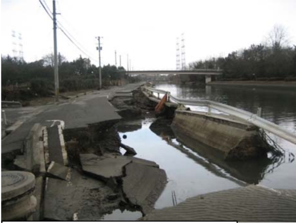
砂押貞山運河（中南部下水道事務所付近） 平成23年3月14日撮影