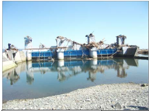
水戸辺川（南三陸町戸倉水戸辺地内）平成23年3月22日撮影