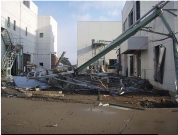
県南浄化センター脱水機棟（岩沼市下野郷地内）