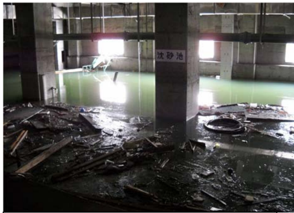
東部浄化センター沈砂池施設（石巻市魚町地内）