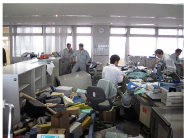
地震により書類等が散乱した執務室