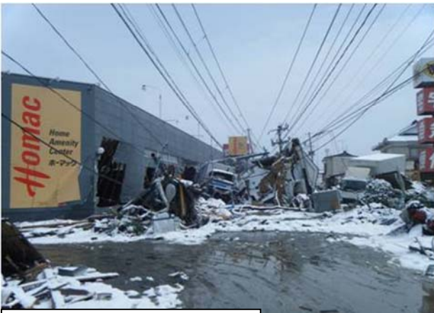
国道398号 (石巻市鹿妻地内)