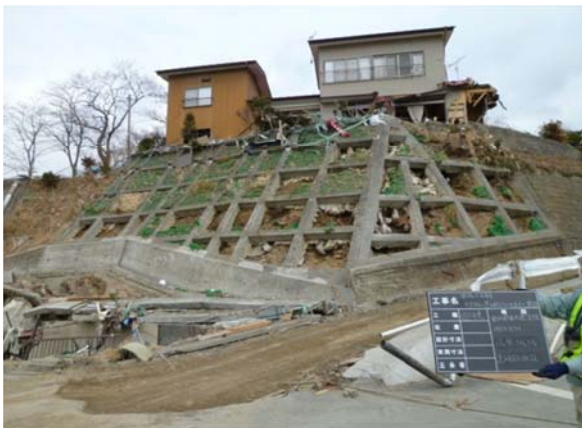
山根白場急傾斜地 (南三陸町山根城場地内) 平成23年3月31日撮影