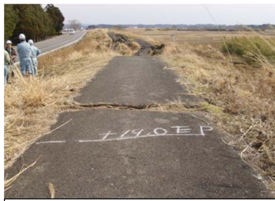
迫川（登米市迫町森地内）平成23年3月14日撮影