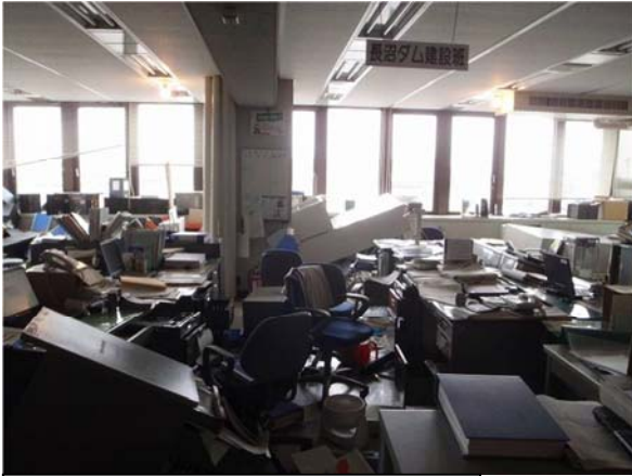
地震により書類等が散乱した執務室