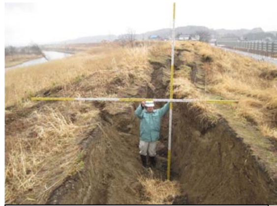
鳴瀬川（色麻町四竈地内）平成23年3月15日撮影