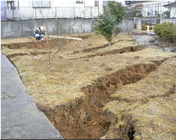
地すべり (仙台市太白区緑ヶ丘地内)