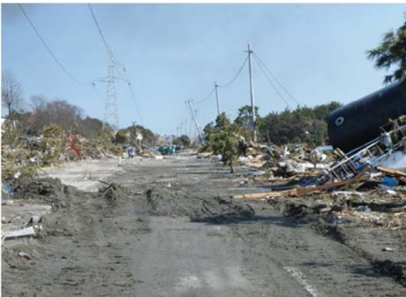
臨港道路蒲生幹線（仙台市宮城野区） 平成23年3月13日撮影