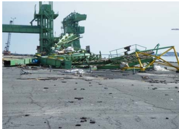
仙台港高砂コンテナヤード（仙台市宮城野区） 平成23年3月13日撮影