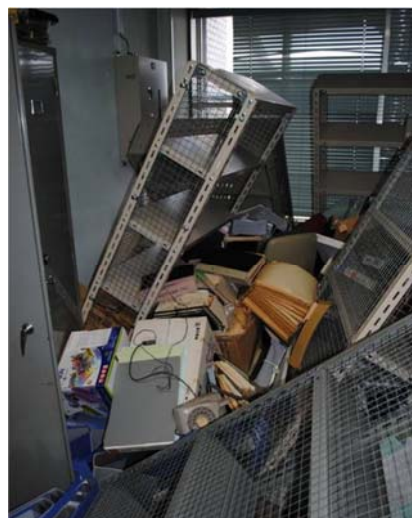
地震により書類が散乱した書庫