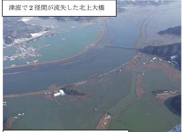
津波で2径間が流失した北上大橋