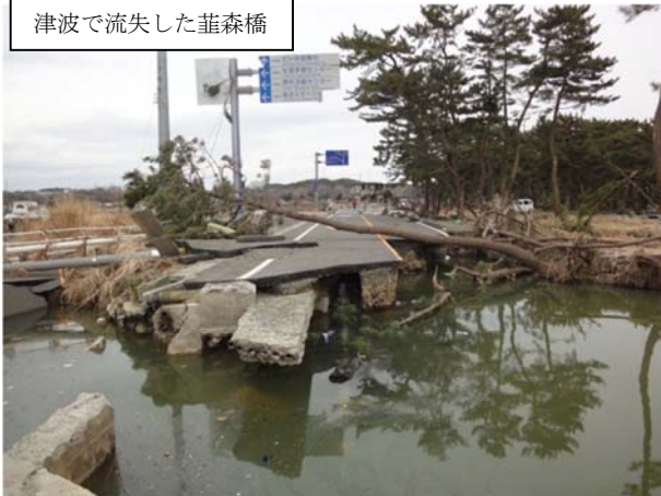
(主)塩釜七ヶ浜多賀城線（七ヶ浜町菰蒲田浜地内）