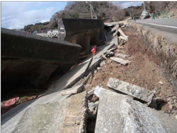
大島高井浜・大向地区（気仙沼市高井地内）平成23年3月23日撮影