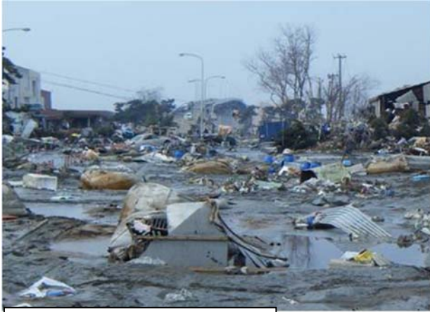
(一) 石巻女川線 (石巻市魚町地内)