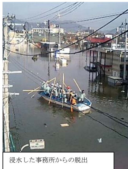
浸水した事務所からの脱出