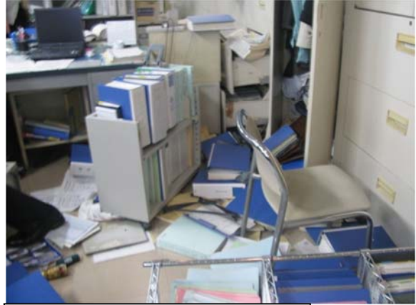
地震により書類等が散乱した執務室