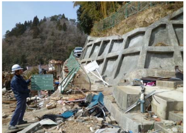
唯越急傾斜地 (気仙沼市唐桑唯越地内) 23年3月20日撮影