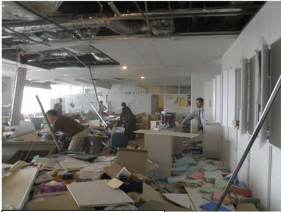
地震により損壊した執務室