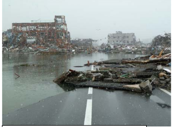
(一)清水浜清水港線 (南三陸町字本浜地内) 平成23年3月16日撮影