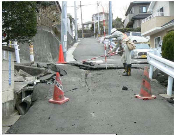
地すべり (仙台市太白区緑ヶ丘地内)