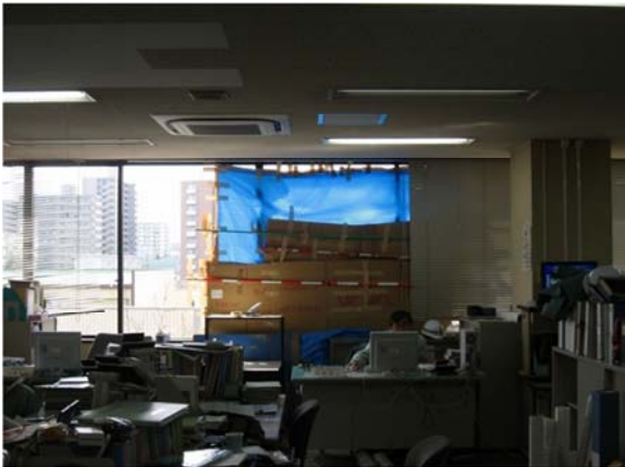
地震により庁舎のガラスが破損