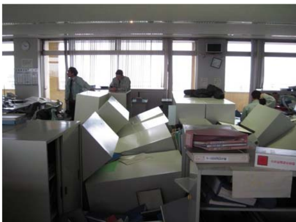
地震により書類等が散乱した執務室