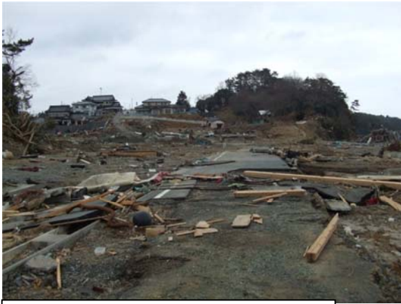
(一)泊崎半島線 (南三陸町歌津字名足地内) 平成23年4月5日撮影