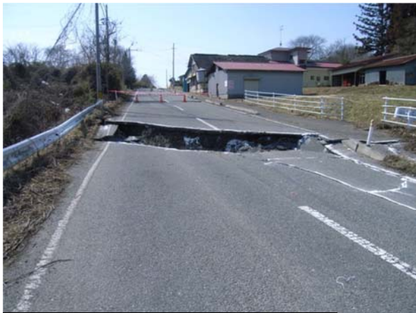
（主）古川一迫線（栗原市高清水手取地内） 平成23年3月14日撮影