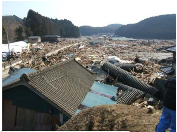
国道398号 (南三陸町志津川字小森地内) 平成23年3月13日撮影