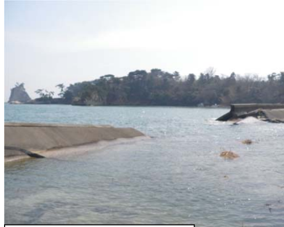
野々島海岸（塩釜市野々島地内） 平成23年4月15日撮影