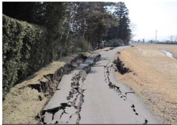
多田川（加美町下狼塚地内）平成23年3月13日撮影