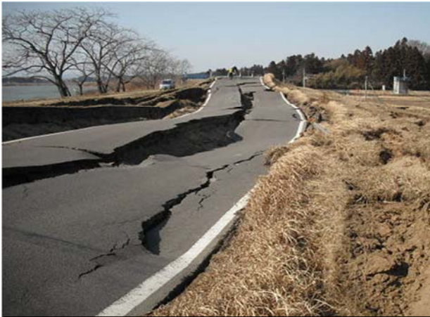
丸森柴田線（角田市坂津田地内）平成23年3月13日撮影