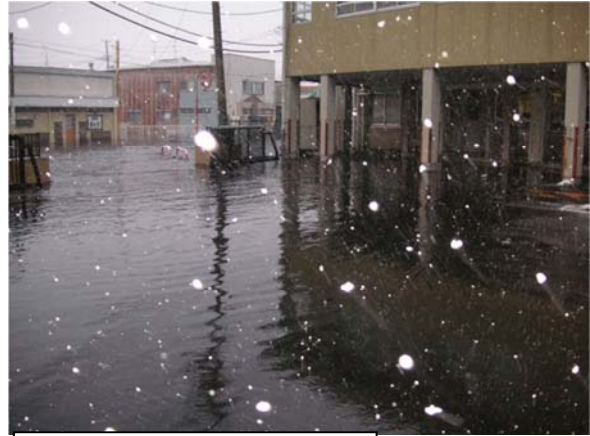
津波により浸水した事務所