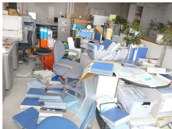
地震により書類等が散乱した執務室