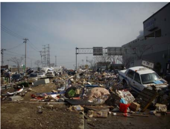
工業地区 (仙台市宮城野区中野地内) 平成23年3月13日撮影