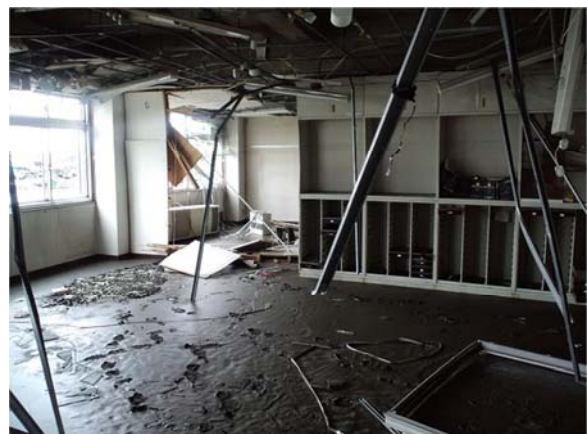
津波により被災した庁舎