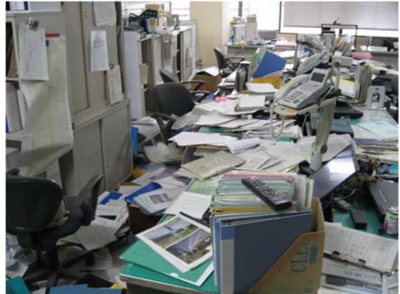
地震により書類等が散乱した執務室