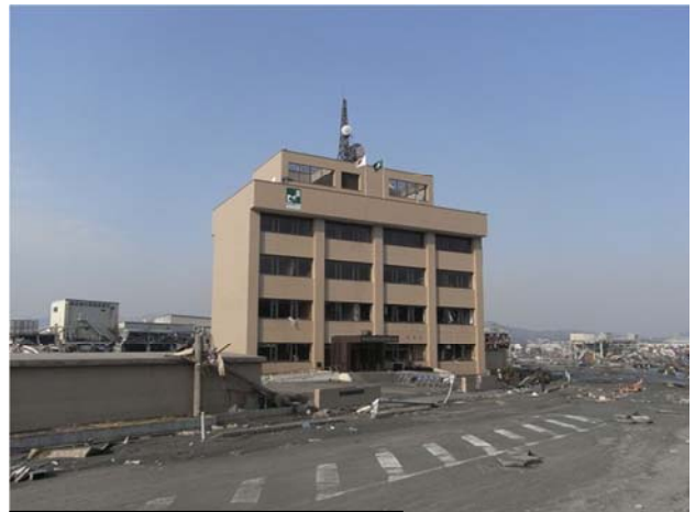
津波により被災した合同庁舎