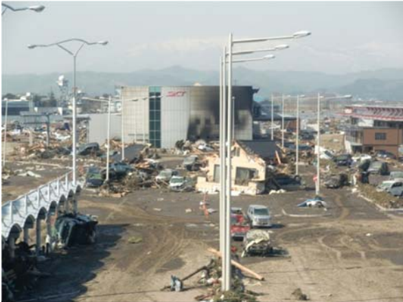
仙台空港ロータリー (名取市北釜地内)