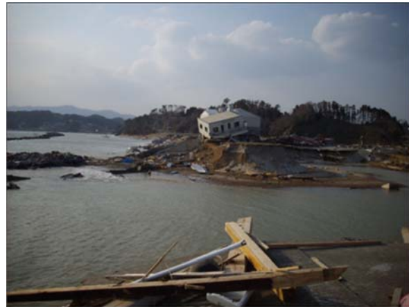
長須賀海岸（南三陸町歌津字長柴地内）平成23年3月29日撮影