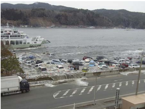
津波襲来時の状況 その1