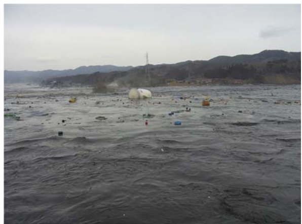
津波襲来時の状況 その4