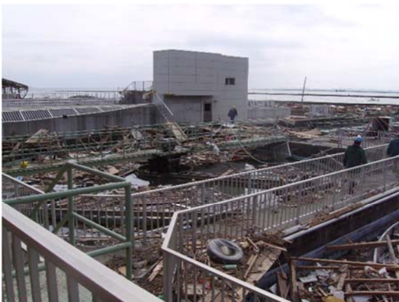
東部浄化センター下水処理施設（石巻市魚町地内）