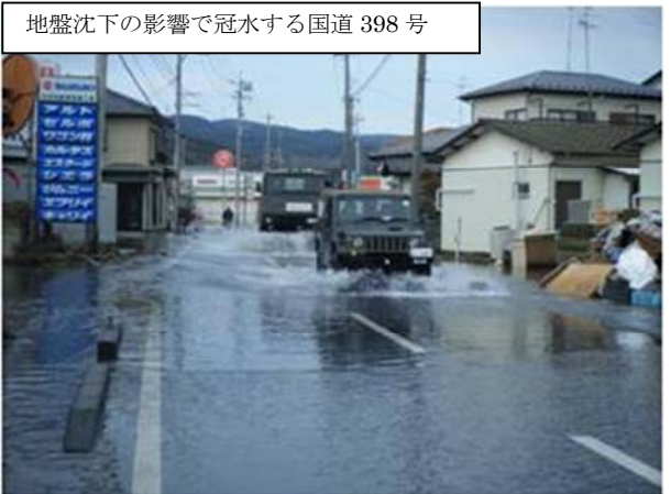
地盤沈下の影響で冠水する国道398号