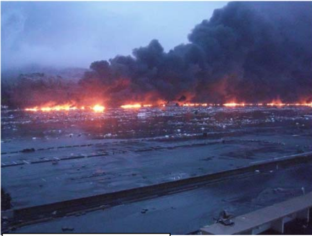
津波による火災の発生状況