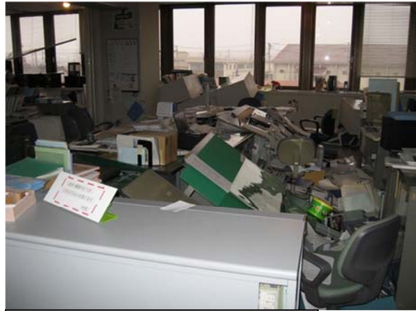
地震により書類等が散乱した執務室