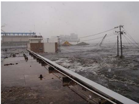
津波襲来時の庁舎