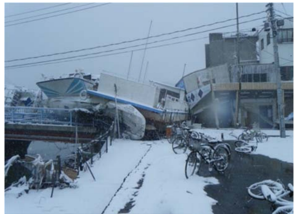
国道398号 (石巻市中瀬地内)