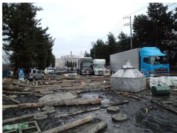
臨港道路釜北線（石巻市重吉町地内） 平成23年3月14日撮影