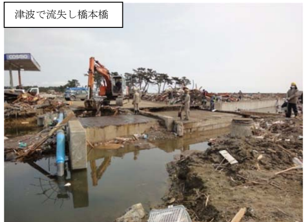
(主)相馬亘理線（山元町中浜地内）