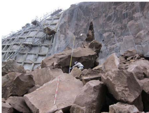
黒崎沢2緊急砂防 (大崎市鳴子温泉地内) 平成23年4月8日撮影