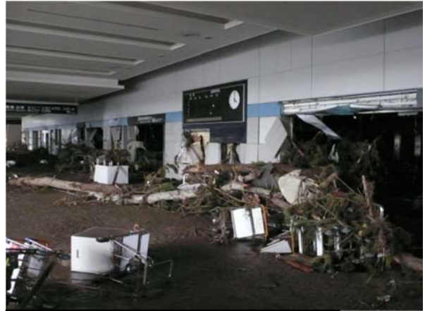
仙台空港ターミナルビル (名取市北釜地内)