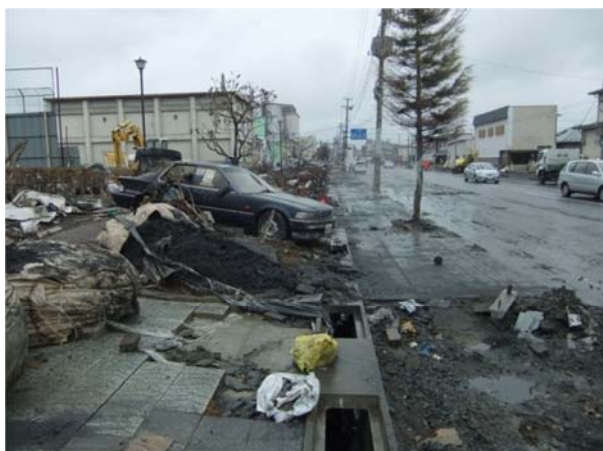
地盤沈下の影響で冠水する(主)塩釜港線