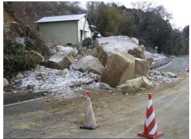
（一）若柳築館線（栗原市若柳上畑岡地内） 平成23年3月12日撮影