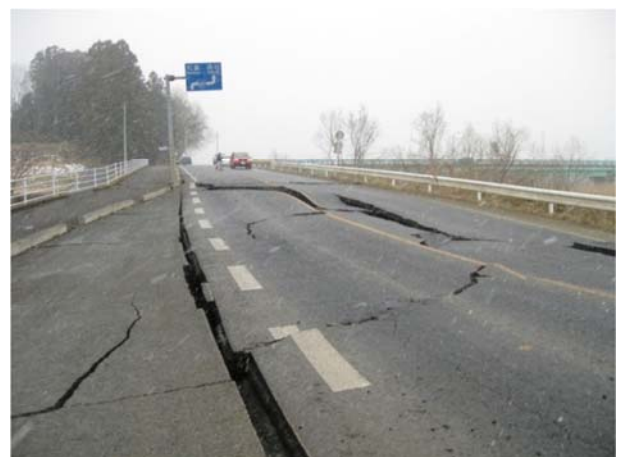
（主）古川一迫線（栗原市高清水手取地内）