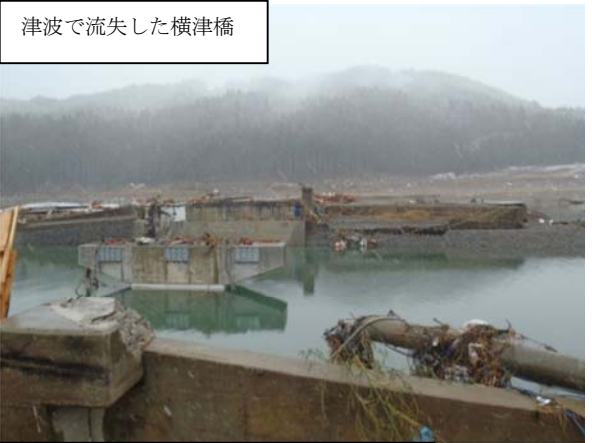
津波で流失した横津橋 国道398号 (南三陸町戸倉字中芝地内) 平成23年3月16日撮影