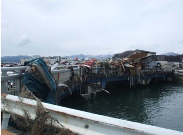
(一)大島波板線 (気仙沼市字波板地内)