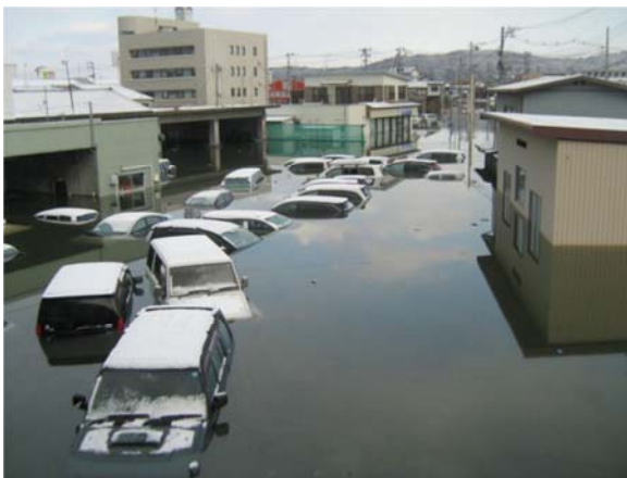
津波により浸水した事務所