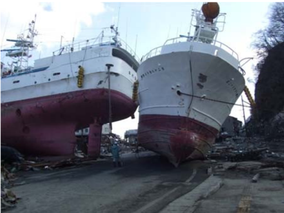
(主)気仙沼唐桑線 (気仙沼市字松崎尾崎地内) 平成23年3月13日撮影