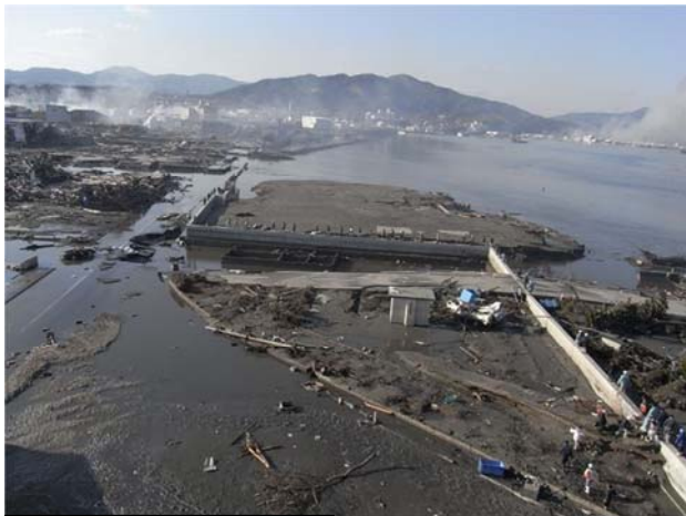
合庁より避難する職員