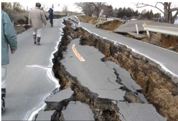
迫川（栗原市若柳字大林境前地内） 平成23年3月12日撮影