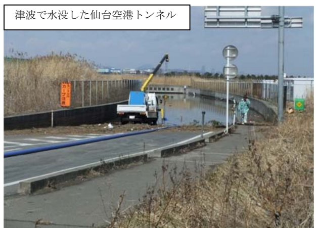
(主)塩釜亘理線（岩沼市下野郷地内）