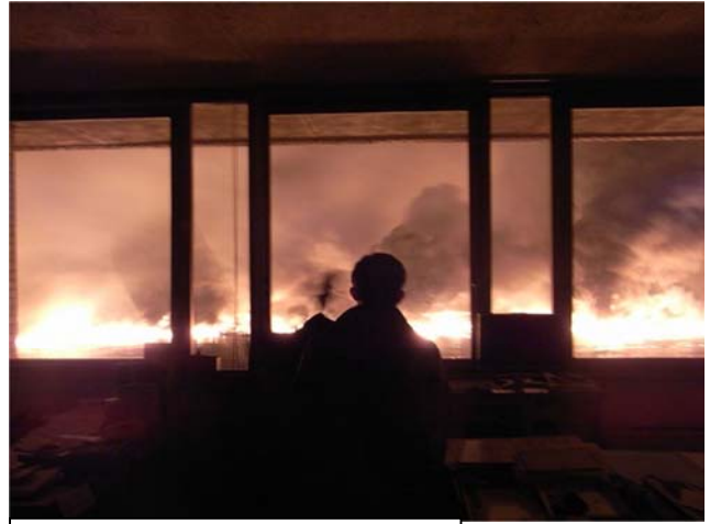
合庁執務室より火災を見守る職員