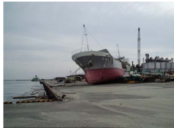
石巻港大手埠頭（石巻市中島町地内） 平成23年3月14日撮影