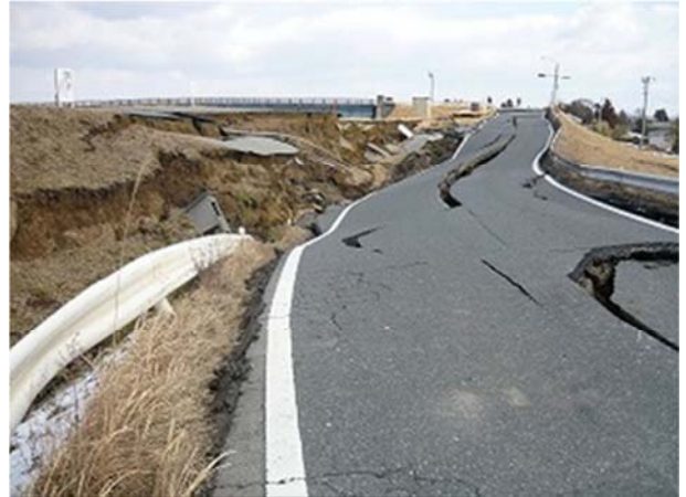
利府松山線（大崎市松山下伊場野地内）