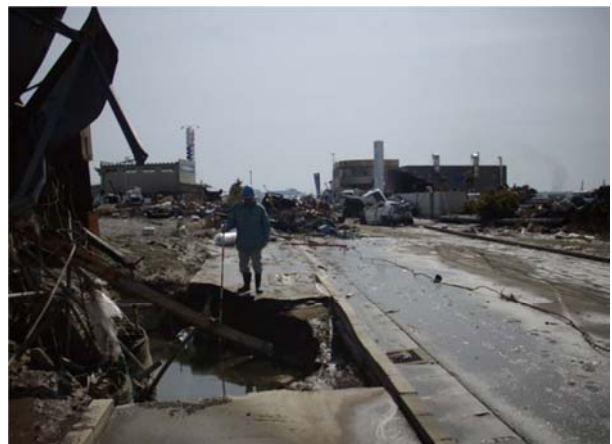
流通業務地区 (仙台市宮城野区中野地内) 平成23年3月13日撮影