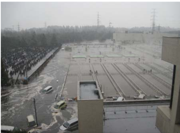
仙塩浄化センター下水処理施設（多賀城市大代地内）