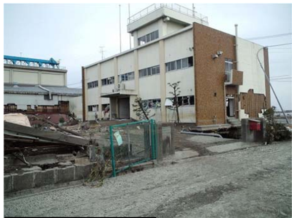
津波により被災した庁舎