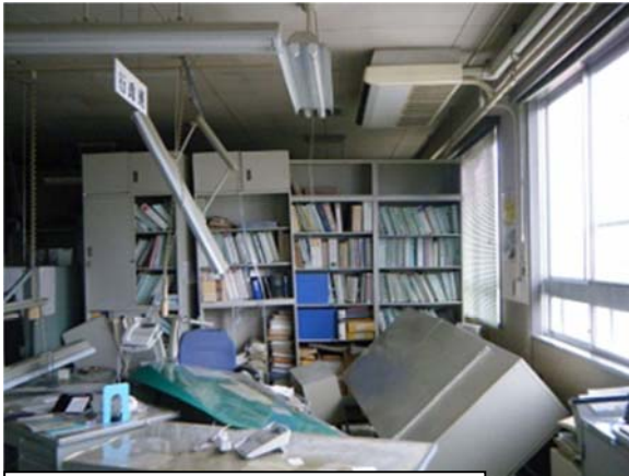
地震により書類等が散乱した執務室