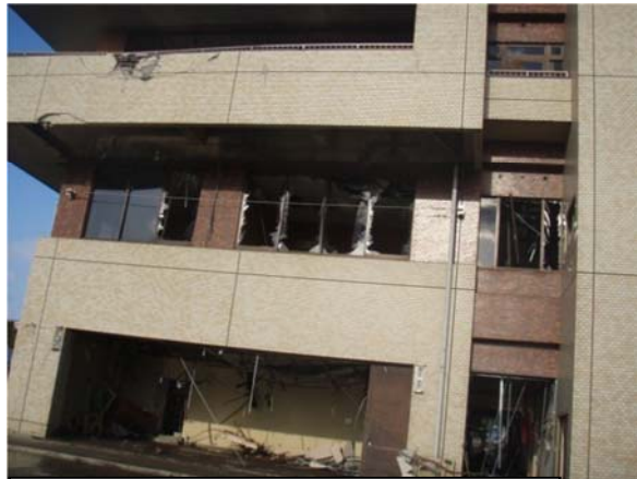
県南浄化センター管理棟（岩沼市下野郷地内）