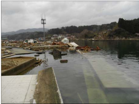
鹿折川（気仙沼市浜町地内）平成23年3月21日撮影