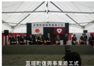
亘理町復興事業着工式