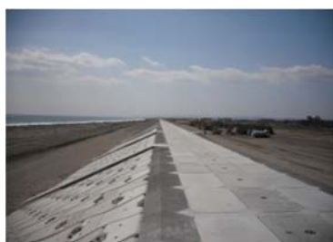
仙台湾南部海岸 (空港区間) 完成状況