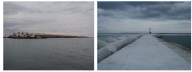
仙台港区新北防波堤 完成状況