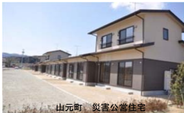
山元町 災害公営住宅