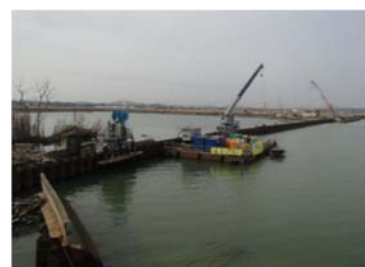
定川河川災害復旧工事状況