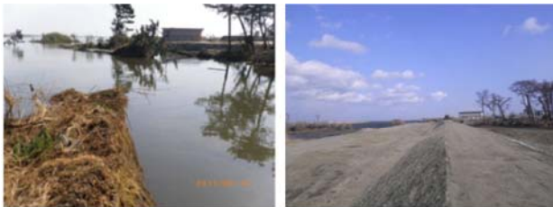
七北田川(右岸) 被災状況・復旧状況