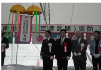
仙台湾南部海岸(空港区間)堤防完成式