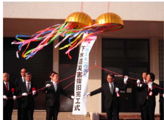
県南浄化センター下水道災害復旧完工式