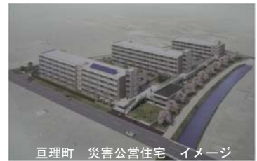
亘理町 災害公営住宅 イメージ