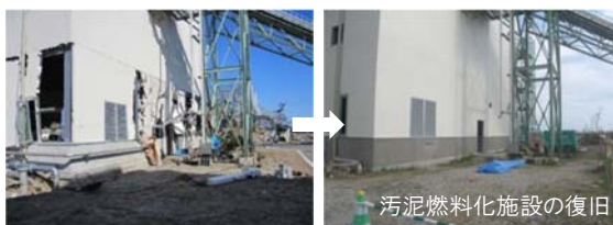
汚泥燃料化施設の復旧