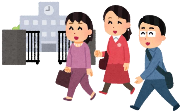
未就学児の保護者を対 象とした「入学説明会」