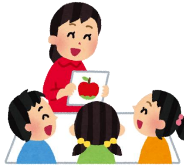
子どもの育ちの理解に つながる「保育参加」