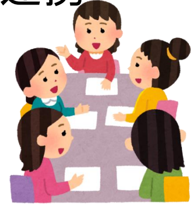
保・幼・小それぞれの 「保育・授業参観後の懇談会」