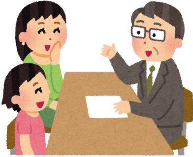
保護者のニーズに応える 「教育相談」「保護者面談」