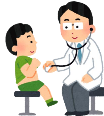
子どもの健康を守る 「就学时健診」