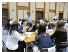
<今年度の研修会の様子>

開催日等決まりましたら、お知らせします。多くの先生方の参加をお待ちしております。