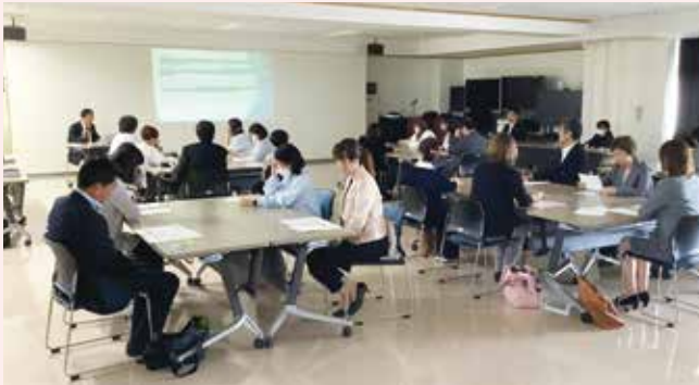
〈東松島市教育委員会 幼保小連絡会議〉

東松島市の私立幼稚園、公立・私立保育所、小学校の先生方、子育て支援課、教育委員会が参加し、合同研修会を行った。幼児教育と小学校教育の円滑な接続について、国や県の方針と関連付けて、保幼小連携の必要性や連携のポイントを共有した。また、幼保小相互のカリキュラムをもとに、互いに何ができているかという共通の視点でグループワークを行った。