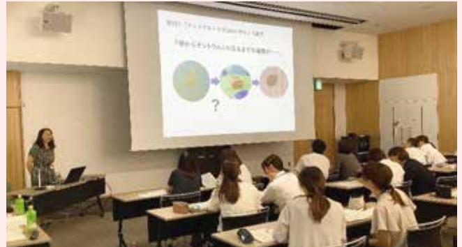
〈大崎市教育委員会 幼稚園研修会〉

大崎市の公立・私立幼稚園、子育て支援総合施設、公立保育所、小学校の先生方が参加し、研修会を行った。「幼児期の遊びの中での学びが小学校教育のどの姿につながっているのか」について、県幼児教育アドバイザーが講話を行った。その後、各園・各校での教育や保育の実際について意見交換を行い、共通理解を図った。