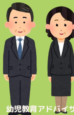
幼児教育アドバイザー