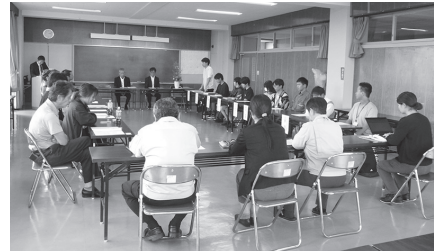
学生からお礼の言葉

受入経営体の皆様の温かいご指導のおかげで、有意義で実りのある学習となりました。ご指導いただきました皆様に感謝申し上げます。