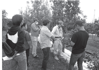
福島県農業総合センター果樹研究所ほ場