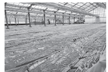
コーヒー残渣を使用した土壌還元消毒