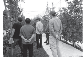
株式会社菱沼農園