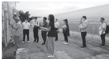
ハウス前にて説明

委員の方々からは、①メロン「クールボジャ」の技術継承に向けたマニュアル作りやさつまいもの育苗では、途中で起きた予期せぬトラブルに迅速な対応を行ったこと、②ほ場整備地区において、担い手への法人化支援や地権者等関係者への合意形成を目指した話し合いを丁寧に行っていること、③若手いちご生産者に対して、気候変動に応じた栽培管理技術の再構築を行っていることなどが評価されるとのご意見をいただきました。また、今後の活動に対するご助言もいただきましたので、これからの普及活動に生かしてまいります。