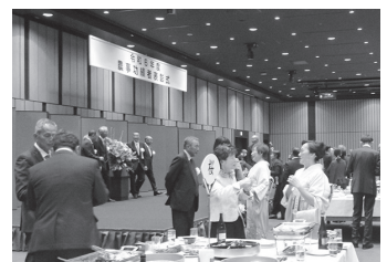
表彰式後の祝賀パーティー