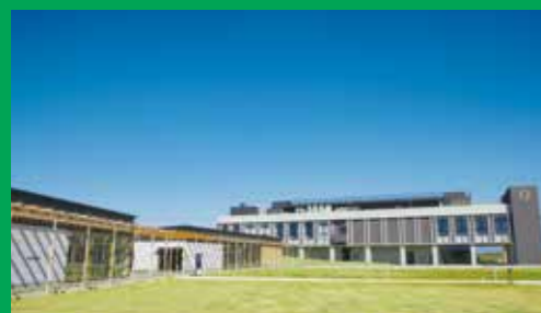
「アクアイグニス仙台」オープン