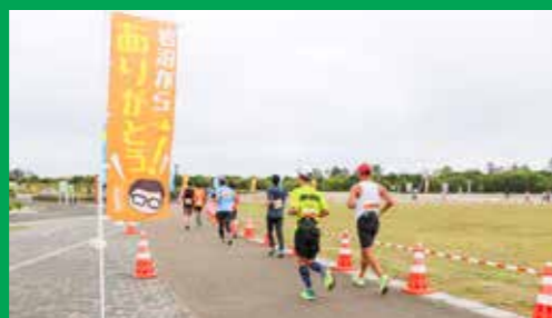
東北・みやぎ復興マラソン2023の開催