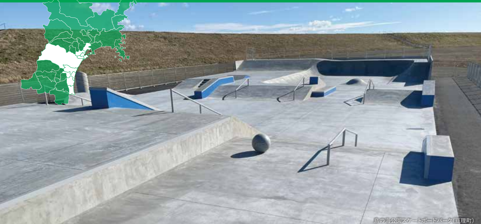
鳥の海公園スケートボードパーク(亶理町)