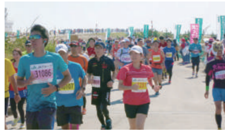
1万3千人のランナーが沿岸被災地を駆け抜けた「東北・みやぎ復興マラソン2017」(名取市・岩沼市・亶理町)

震災の伝承施設として整備が進められてきた「震災遺構仙台市立荒浜小学校」は、平成29年4月に整備が完了。東日本大震災で被災した学校施設としては初めての一般公開で、防災・減災の意識を高める場として、常時公開しています。