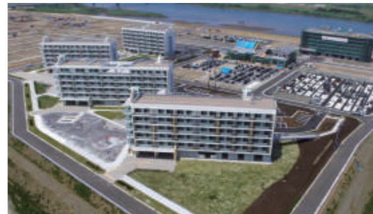
名取市内最大の災害公営団地が完成(名取市関上地区)