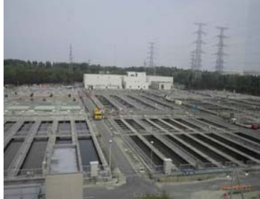
処理場 遠景 (下図、矢印)