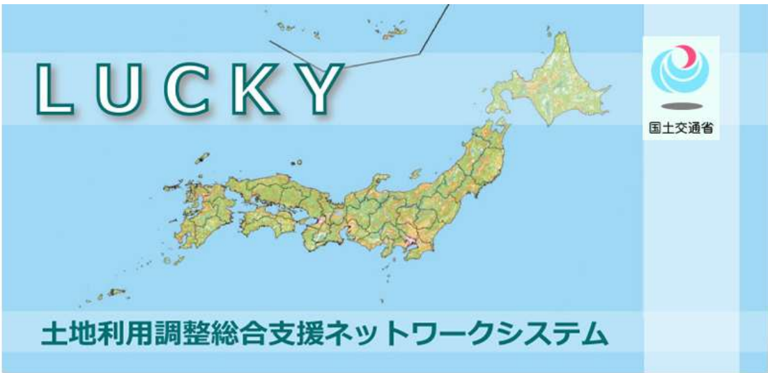
土地利用調整総合支援ネットワークシステム(LUCKY:Land Use Control bacK-up sYstem)とは 国土利用計画法9条に基づき、都道府県が策定する土地利用基本計画図を電子化し、 インターネット上で情報発信等を行うシステムです。(以下、「本システム」という。)

土地利用調整総合支援ネットワークシステム (LUCKY) ( http://lucky.tochi.mlit.go.jp/ ) …国土利用計画法9条にもとづき、都道府県が策定する土地利用基本計画図を電子化し、インターネット上で情報発信などを行うシステム。