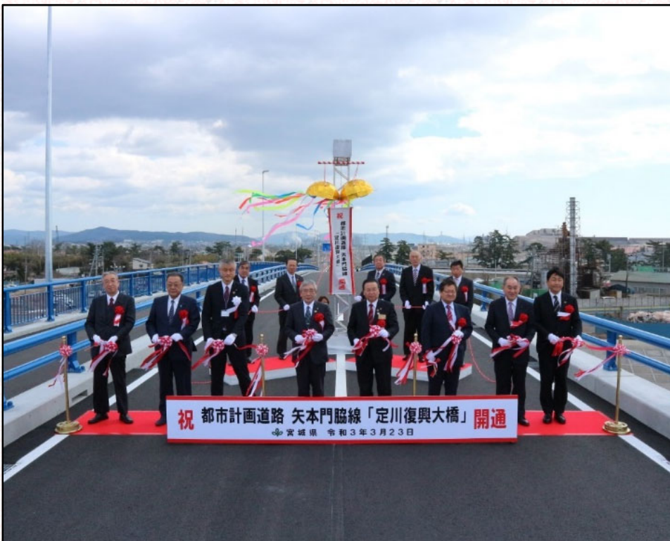
テープカット及びくす玉開披