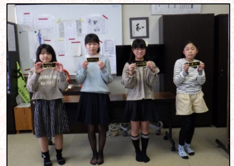
橋名板をデザインして下さった大曲小学校の児童の皆さん