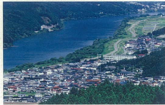
登米市の母なる北上川、豊かな水が農作物の源