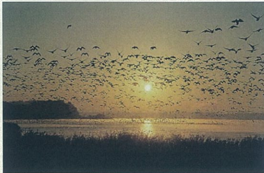
ラムサール条約登録湿地の伊豆沼・内沼は、日本一の渡り鳥の飛来地