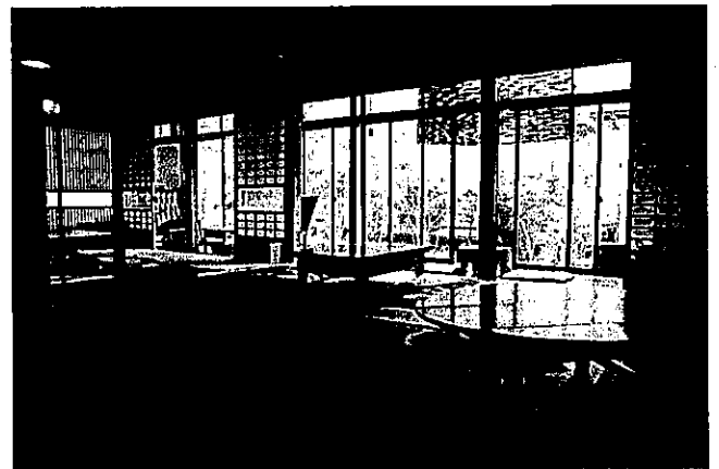
Fig. 3 cafe はまぐり堂

カフェのメニューにはできる限り旬の地域食材を使うよう検討した。メインははまぐりセット (季節のお惣菜、おむすびまたはパン、味噌汁) (Fig. 4) と鹿カレー (Fig. 5) だ。荻浜地区はカキ養殖が主たる産業であり、副業としてコオナゴ漁、刺し網漁、定置網漁、カゴ漁、カギ漁などを行っている。近隣ではノリ養殖、ホヤ養殖、ワカメ養殖、