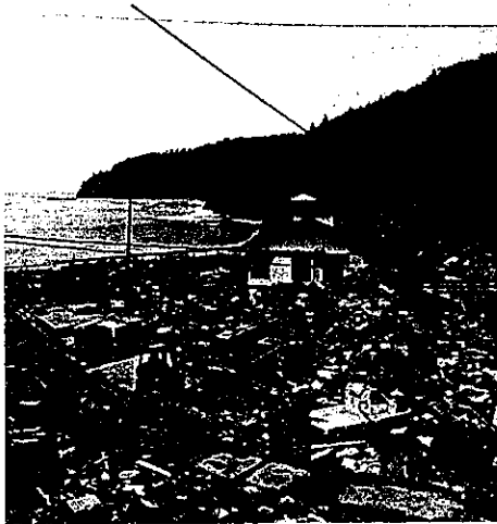
Fig. 2 津波後の蛤浜

計画を住民と地権者に相談し同意を得ることができた。しかしながら、土地を活用させてもらうことには賛同ももらったが、高齢者は一緒に活動することは難しく、同世代も今の仕事を辞めてまで一緒に動くことはできなかった。そこで、当時支援で関わって頂いていたNPOや大学、行政の担当者などに相談したが、親身になって聞いてくださるものの、資金面や人材確保の部分は一向に目処がつかなかった。