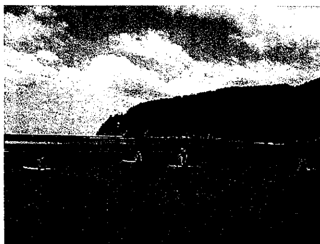
Fig. 10 SUP (スタンドアップパドルサーフィン)

はリアス式で様々な表情があるため絶好のスポットである。昨年、試験的に体験を行ったが、参加者からも好評で、今年は本格的にボートハウスを建設し常時体験できるものとして展開していく予定である。