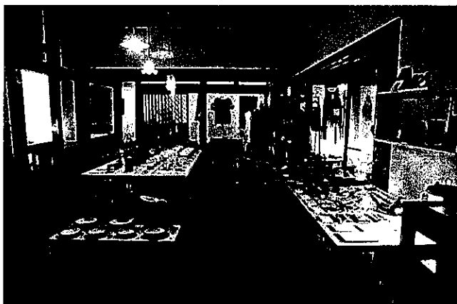
Fig. 6 セレクトショップ高見

カフェの隣家は2015年4月からセレクトショップ高見として営業を始めた (Fig. 6)。鹿革を使ったオリジナルの商品や石巻の陶芸家の器、大漁旗をリメイクした服や小物など、地域の作家や素材を使ったものを販売している (Fig. 7)。また一画を画廊とし、浜の石や鹿、クジラなど地域の素材をテーマに芸大生や地元アーティストの個展を行っている。この家も震災の被害は少なかったが、津波で奥さんが亡くなり市街地へと引っ越した。家主さんにプロジェクトに賛同して頂き、購入して活用させて頂くことにした。当初は浜の暮らしを体験できる漁家民宿として改装するため建築科の学生に協力を呼びかけた。全国7大学から15名が集まり、2泊3日の合宿を行い、地域性を出しながらも低コストで改装できる方法を検討した。明治大学の門脇研究室の協力を頂き、学生が卒業設計として住み込みで改装に取り組むことにした。床や建具は大工さんをお願いしたが、それ以外の解体、清掃、作り込みを学生やボランティアとともに行った。この家も築70年以上になるため、壁を撤去すると昔ながらの土壁や欄間、太い梁など