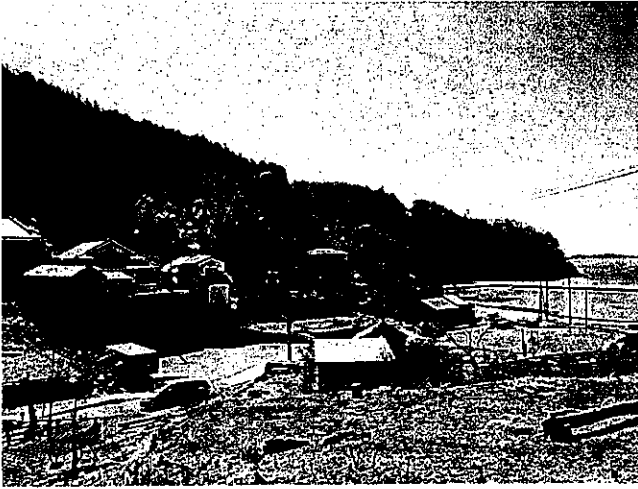
Fig. 1 現在の蛤浜