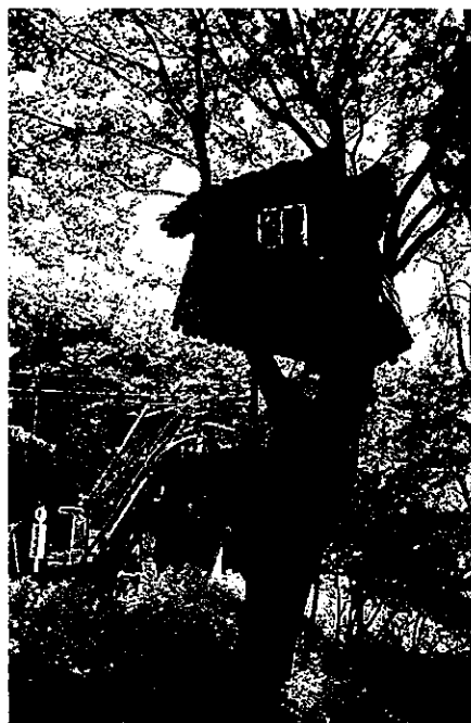
Fig. 9 ツリーハウス

大人にも子どもにも自然に親しむ機会を増やし、自然を大切に豊かさや美しさを後世に残して行けるよう様々なアクティビティーを考えている。近年 SUP (スタンドアップパドルサーフィン, Fig. 10) が関東を中心に流行している。ハワイ発祥のマリンスポーツで、サーフィンより浮力のある大型のボードに立って乗り、パドルを漕いで進むものである。波がない場所でもできるため、港湾や河川、湖でも実施することができる。カヤックのようにゆったりとクルージングするのに向いていて、牡鹿半島の地形