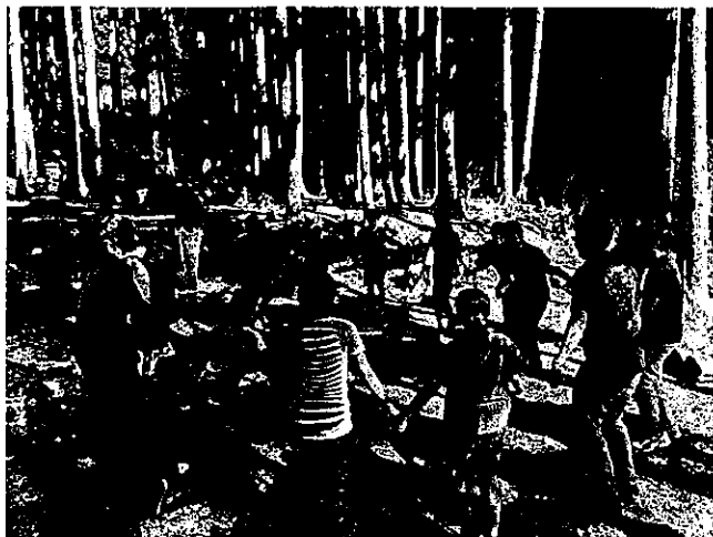
Fig. 8 ネイチャーゲームの様子

して行っていきたいが、土地の使用や造成工事など課題があり、現在は休止している。将来的には森のようちえんやフリースクールも含め検討していきたい。