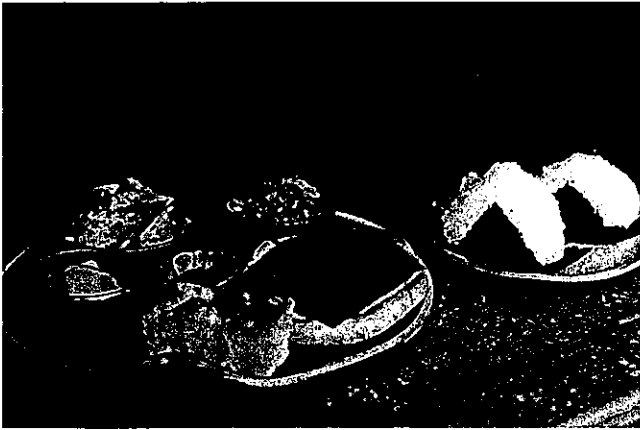
Fig. 4 はまぐりセット