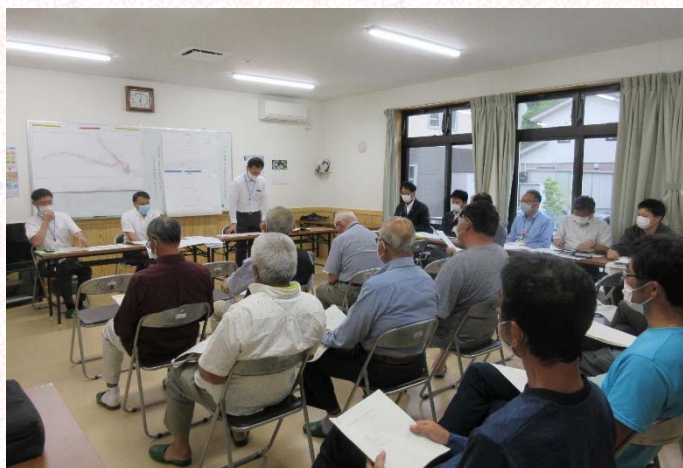
6月18日 大浜地区 説明会の様子