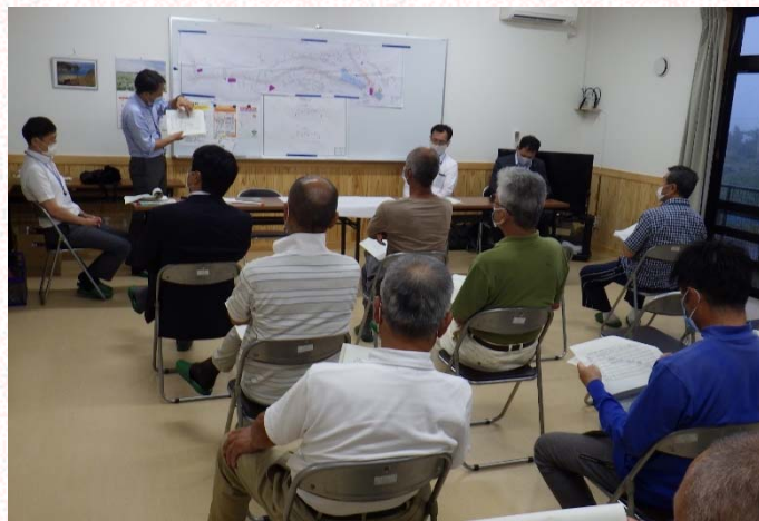
6月30日 月浜地区 説明会の様子