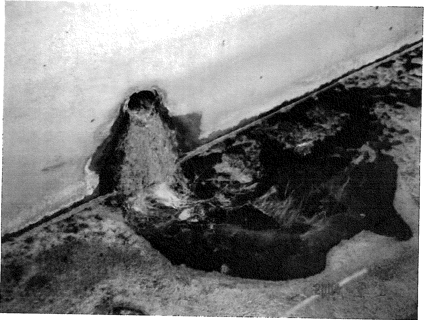
東側 処分場、7~10工区。 東側、側溝より侵出している