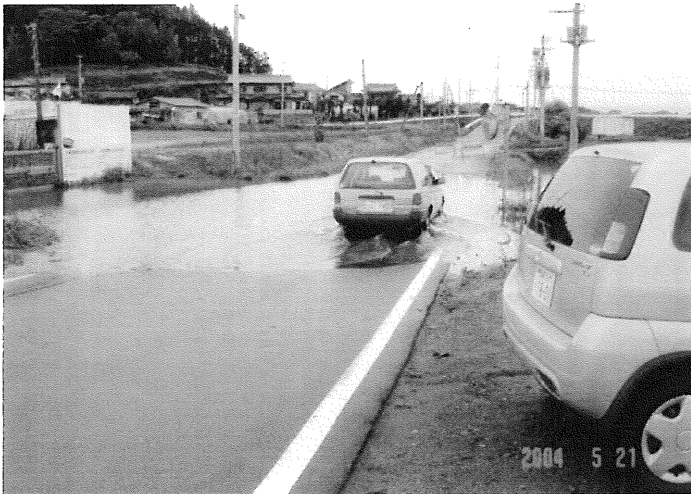
久留川合場先の道路。