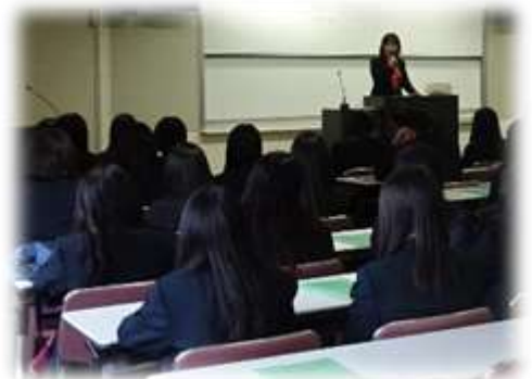
過去の「入社準備セミナー」の様子