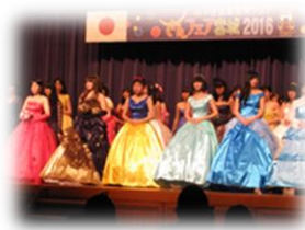
ファッションショー【家庭】