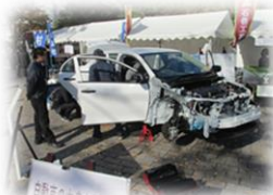
自動車解体ショー【工業】