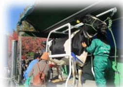
乳牛の乳搾り体験【農業】