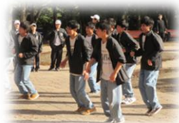
ダンスパフォーマンス【古工】

来場いただきました皆様、懸命に頑張った生徒・先生方に感謝申し上げます。ありがとうございました。