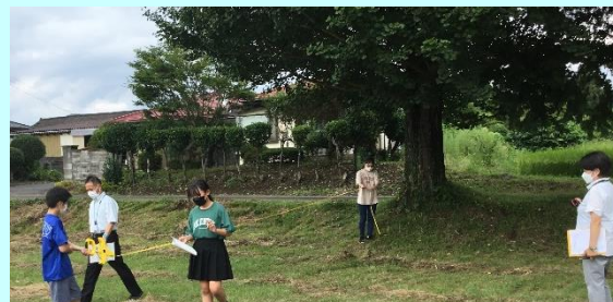
第4回「川崎二小の算数の授業(6年)」

参加者から「授業中の声掛けや発問などの仕方を実際に見て学ぶことができた」などの感想があり、児童生徒主体の授業について考える機会になりました。