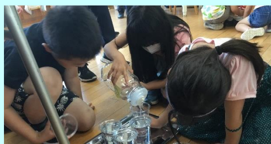
第2回「富岡小の算数の授業(2年)」

自分が考えた式をタブレット等を使いながら、ペアで考え方を伝えるなど、協働的な学びの姿が見られました。