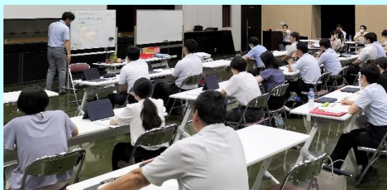
第3回「研修会(講話・模擬授業)」

3つの異なった瓶の水のかさを比較する場面で、コップ何杯かで比べる方法を考え、実際にグループで操作しながら理解を深めていました。