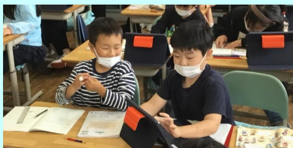
第1回「川崎小の算数の授業(2年)」

自分が考えた式をタブレット等を使いながら、ペアで考え方を伝えるなど、協働的な学びの姿が見られました。