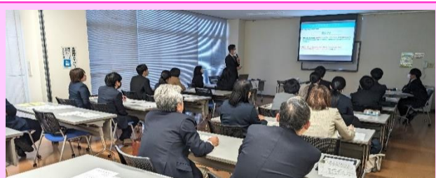
第4回「ふるさと文化会館で行った研修会」

小中の垣根を越えて、「正確に読む」という点について熱心な意見交換が行われました。小中の学習の系統性を意識し、それぞれの校種・学年で取り組むべきことについて共有しました。