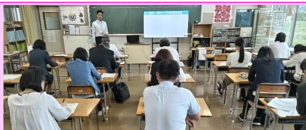
第1回「宮中で行った研修会」

小中の国語科における授業実践上の課題について確認し、その後の研修会では、『個別最適な学び』と『協働的な学び』の一体的な充実に向けて「正確に『読む』ための日々の取組」についての講話を聞き、研究授業の方向性について認識の共有を図りました。