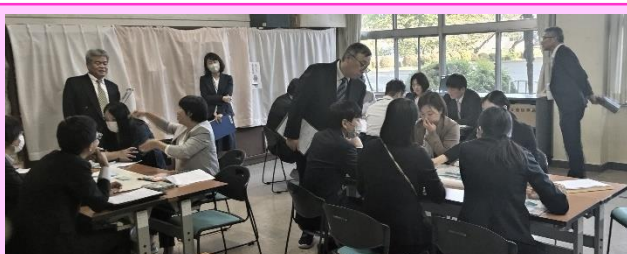
第3回「宮小の授業検討会」

説明的な文章「オオカミを見る目」の授業で、「問い」と「答え」の関係を捉えさせ、その答えの部分を要約させる学習でした。生徒が主体的に取り組み、他者と協働しながら学びを進める姿が大変印象的な授業でした。