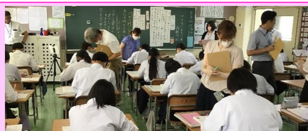
第2回「宮中の国語の授業(1年)」

小中の国語科における授業実践上の課題について確認し、その後の研修会では、『個別最適な学び』と『協働的な学び』の一体的な充実に向けて「正確に『読む』ための日々の取組」についての講話を聞き、研究授業の方向性について認識の共有を図りました。