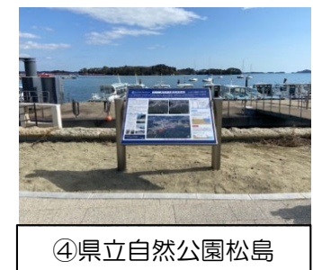
④県立自然公園松島