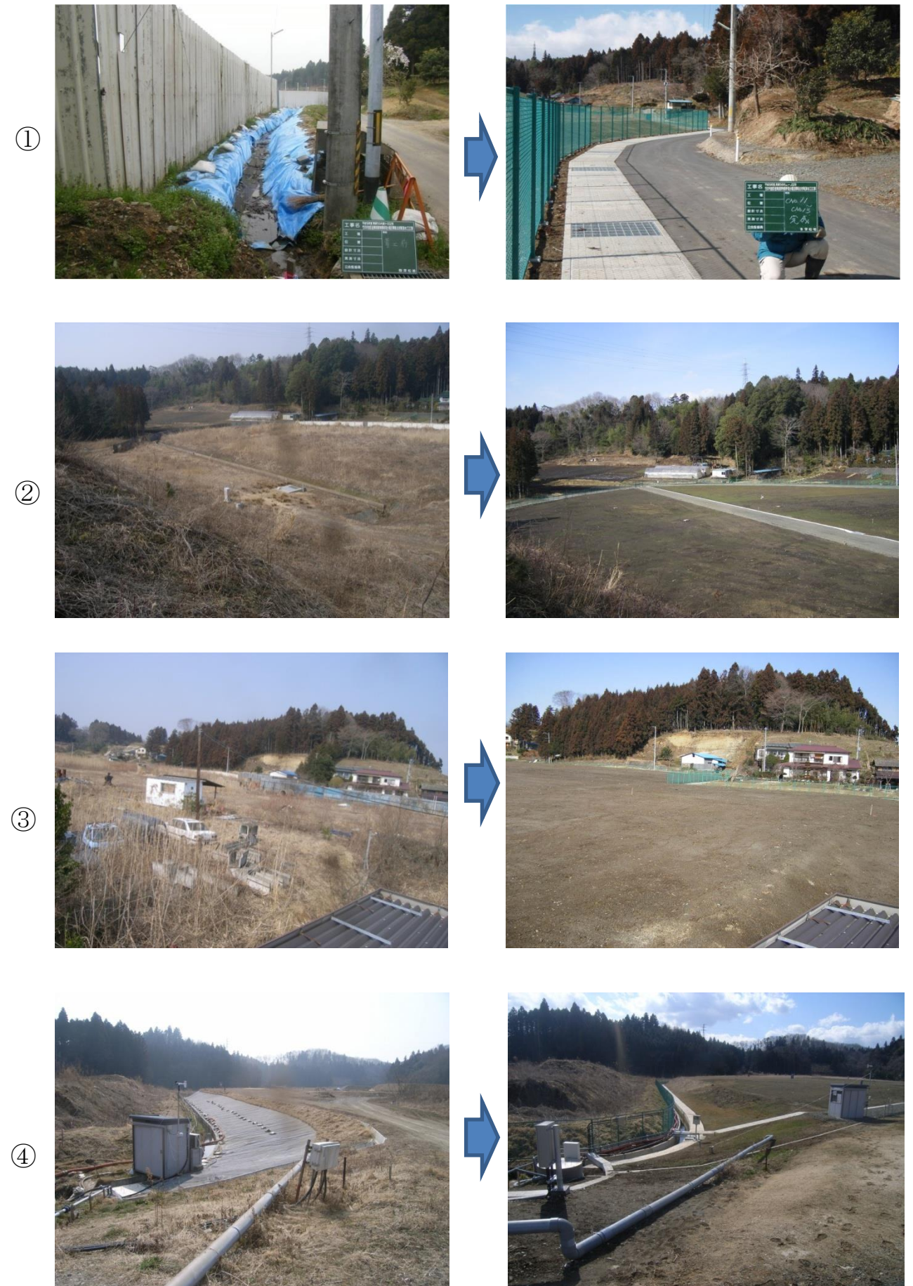
雨水浸透防止対策施工図（工事前後比較）