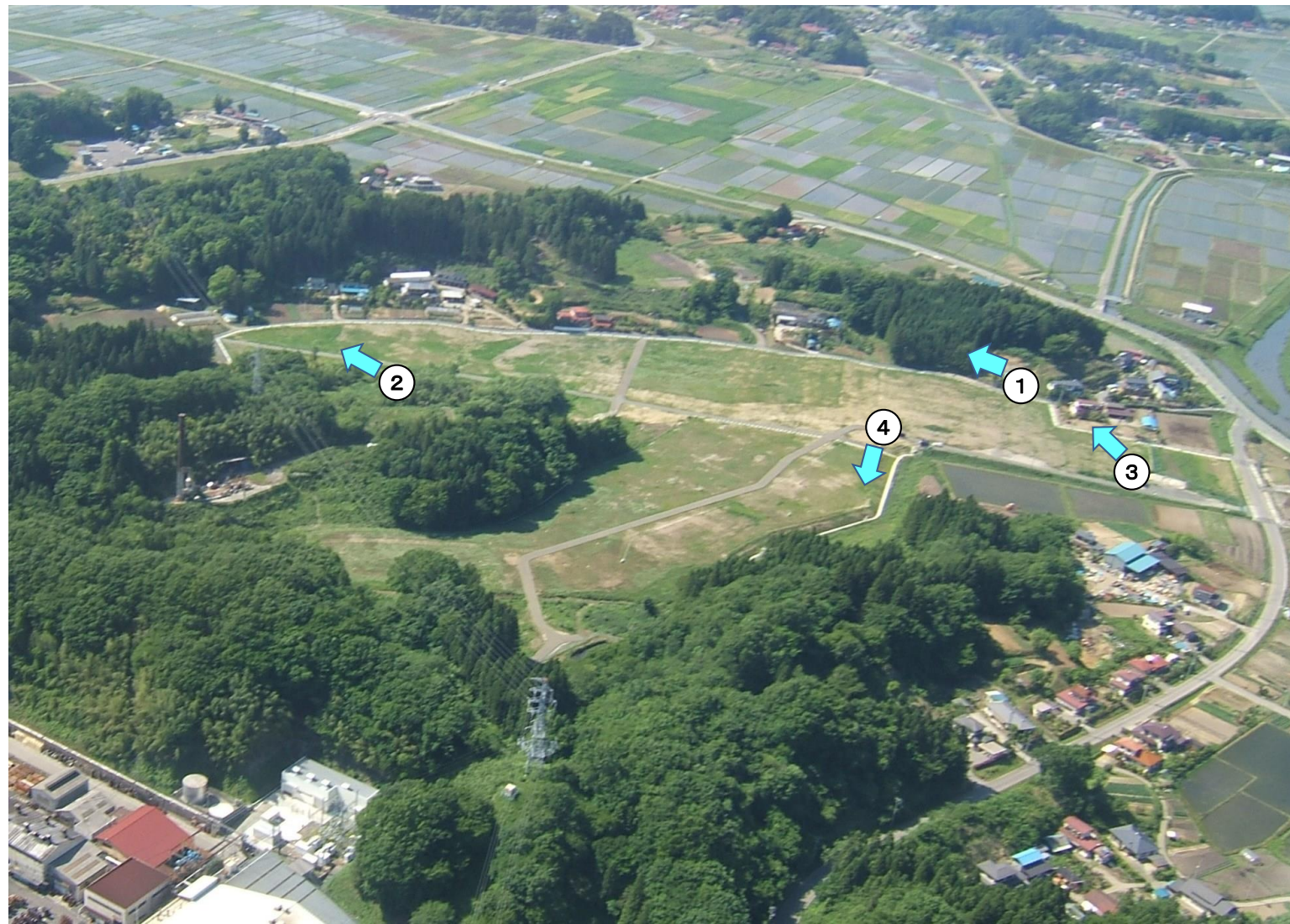
雨水浸透防止対策写真