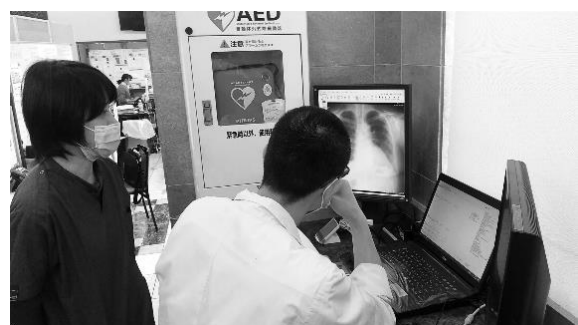
医師の検査データ閲覧