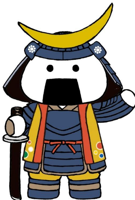
仙台・宮城観光PRキャラクター むすび丸