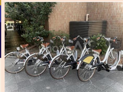
広報物を活用したPR