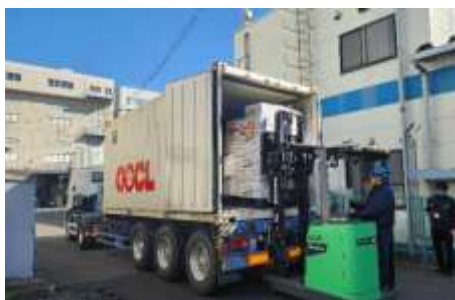
冷蔵コンテナへの積込の様子