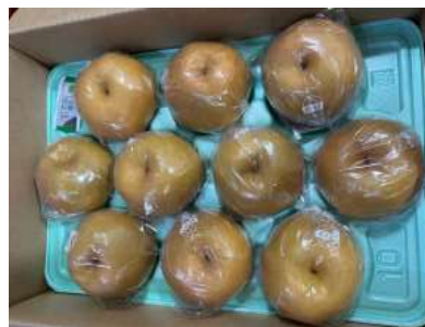
鮮度保持資材で包装した日本 なしの現地着荷状況 （品質劣化なし）