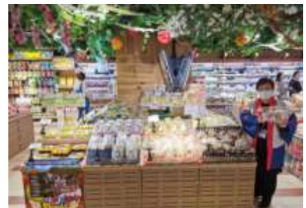
香港 DON DON DONKI での東北 産青果物フェアの開催状況