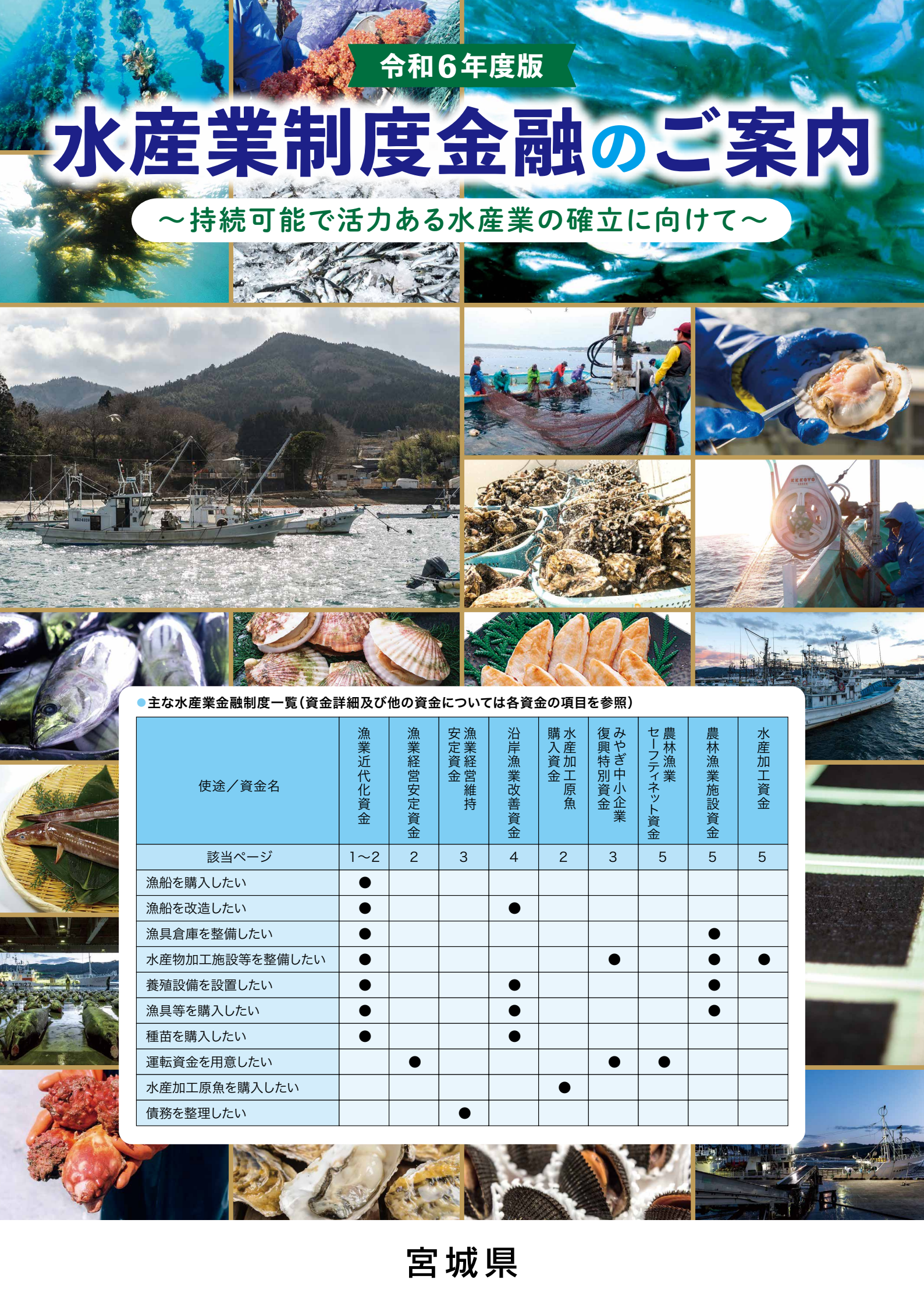
●主な水産業金融制度一覧(資金詳細及び他の資金については各資金の項目を参照)