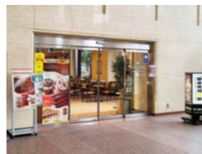
県庁1階カフェラウンジ