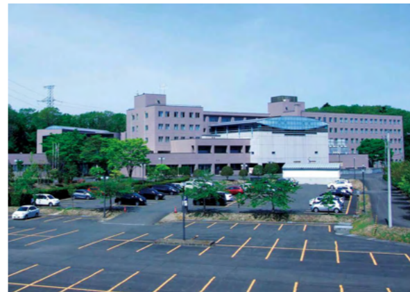
公務研修所(東北自治総合研修センター内)

自立的な能力開発機会の提供として、eラーニング研修の実施や通信講座を開設し、受講支援を行っています。