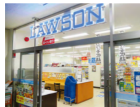
県庁2階コンビニエンスストア