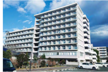
下愛子県職員寮(仙台市青葉区)

世帯用の職員住宅や单身・単身用の職員寮が県内各地に設置され、生活の拠点として利用されています。