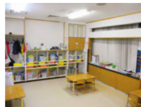
みやぎっこ保育園